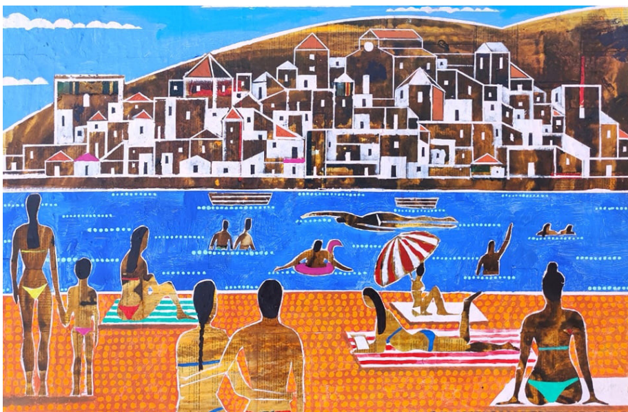
Summer (2021) 70x100 Tècnica mixta sobre tela

Cada artista hauria de tenir el seu activisme, valorar quin és el seu paper al món i a la vida. Les seves creacions no haurien de ser un reducte egòlatra i reduccionista i les seves obres haurien de ser un sincer compartir amb els altres allò que l'inquieta amb la necessitat d'afegir-ho a les preocupacions genèriques de la seva època i la seva societat.