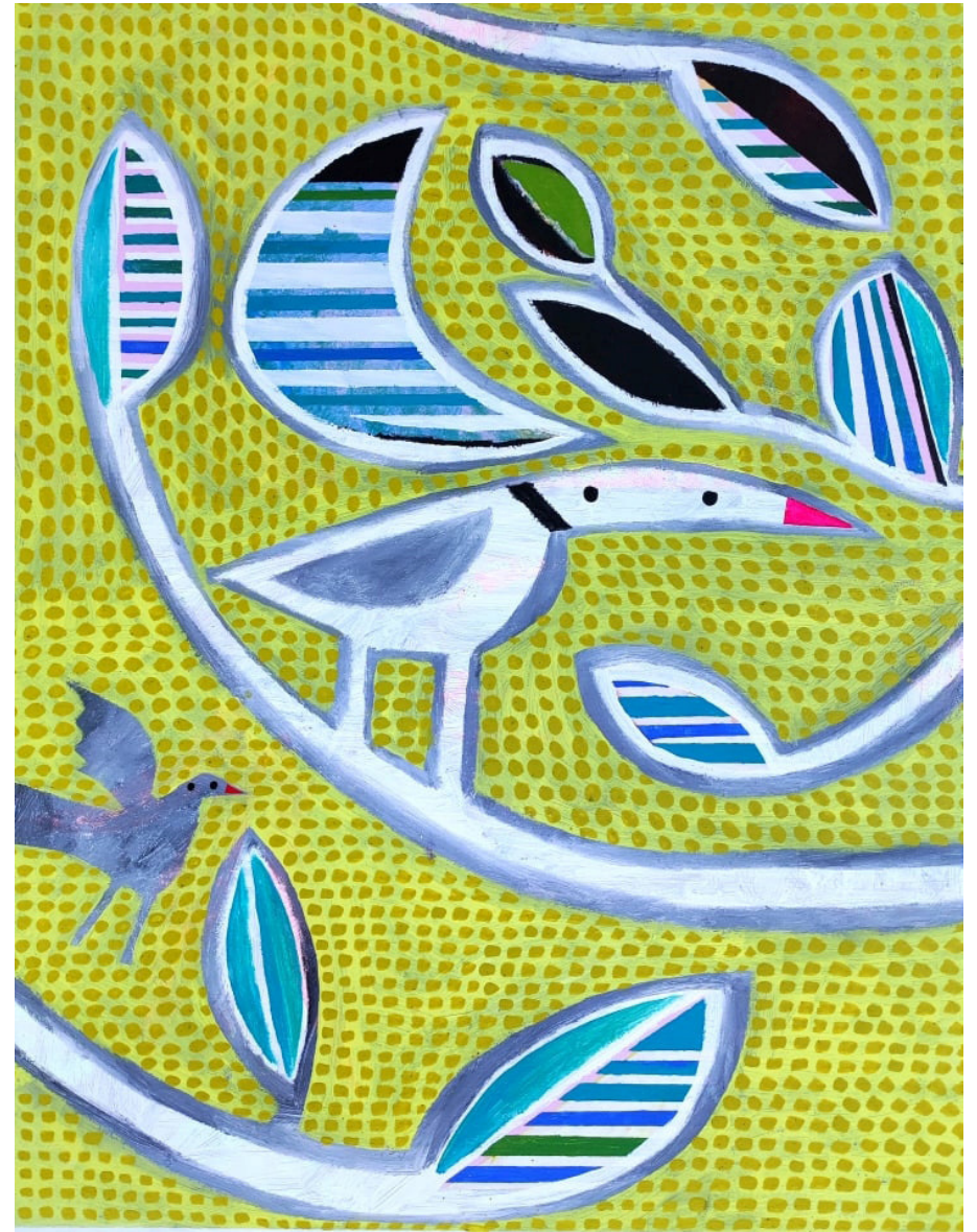
Groc (2021) 80x65 Acrylic sobre tela