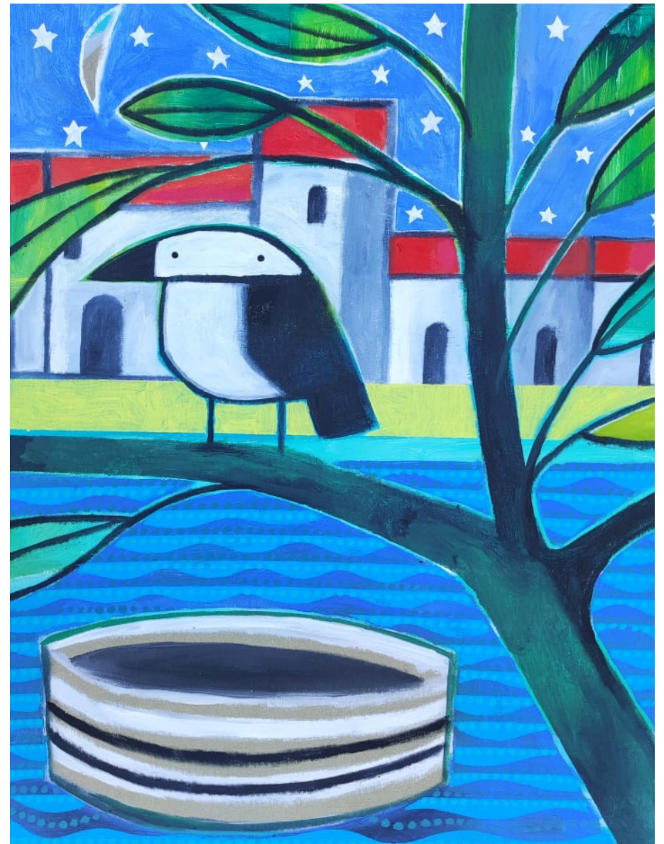
Nocturn (2021) 81x65 Acrílic sobre tela