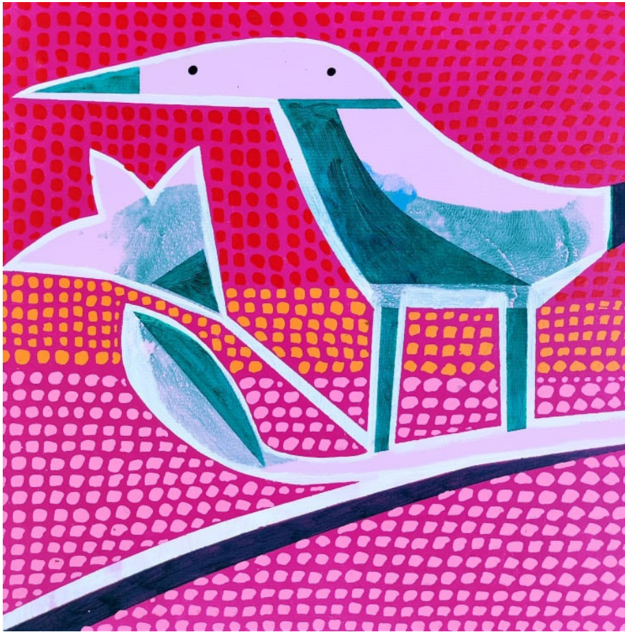
Ocell (2021) 40x40 Acrylic sobre tela