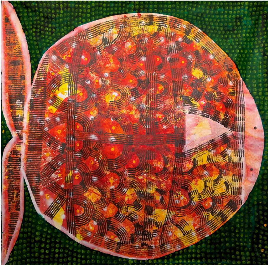
Big Fish (2021) 210x210 Acrílic sobre tela

«Resistir no és tan sols propi d'anacoretas o ermitans. Existir és, en part, resistir .» 1