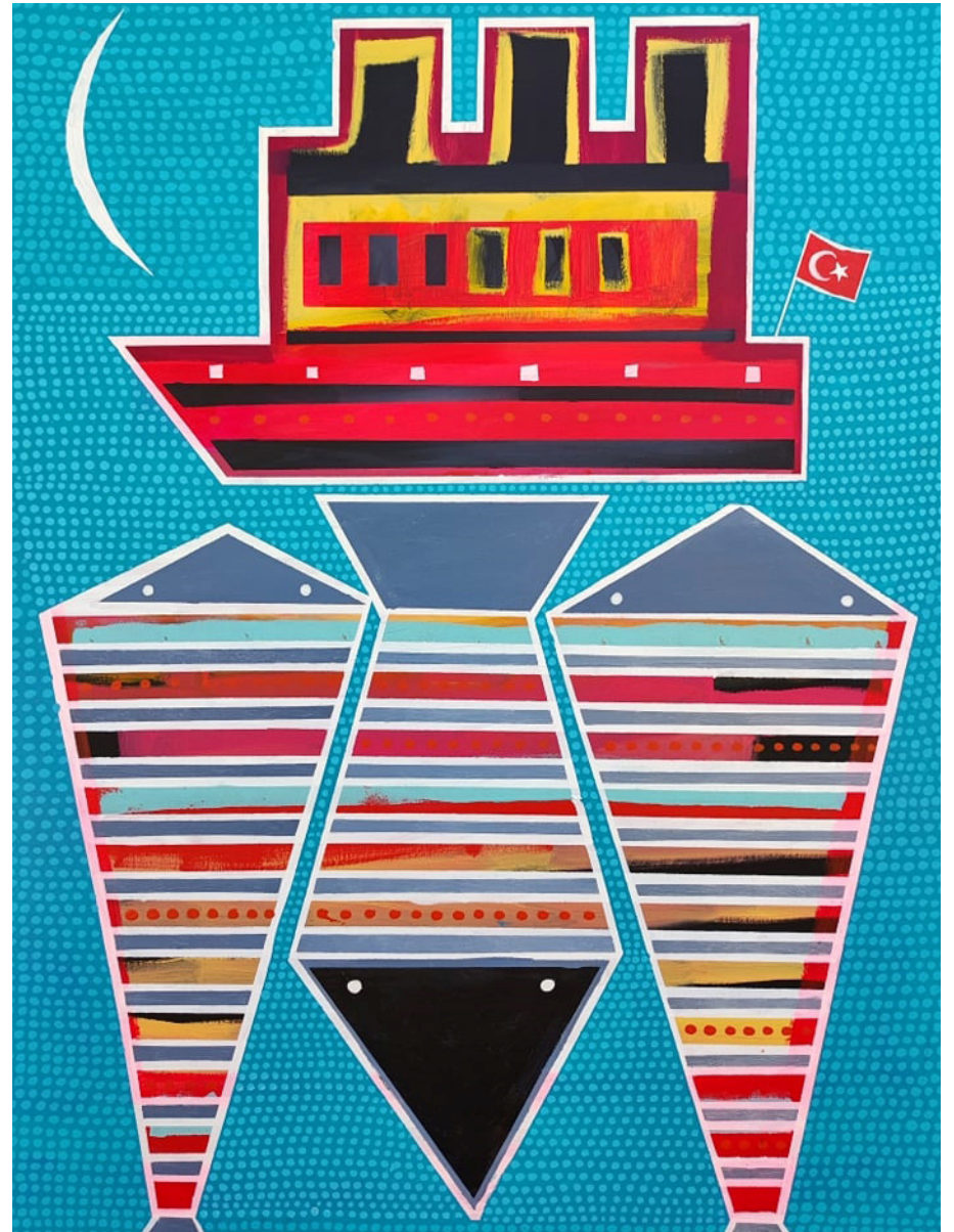
Turkish boot (2021) 116x89 Acrílico sobre tela