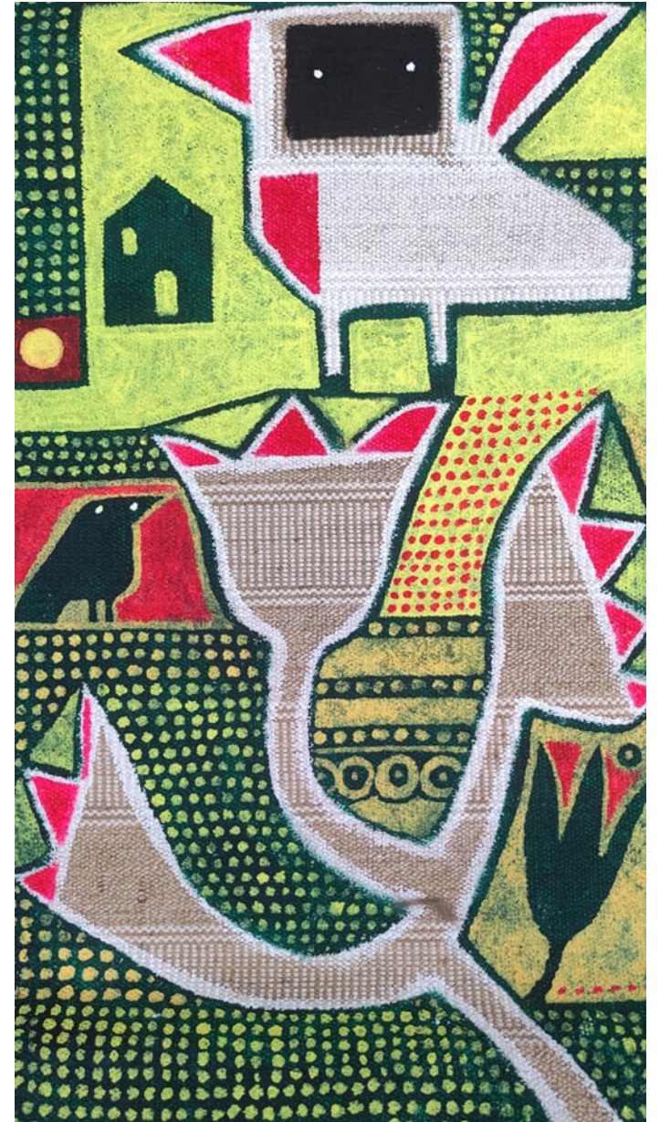
Old (2021) 80x40 Acrílico sobre arpillera