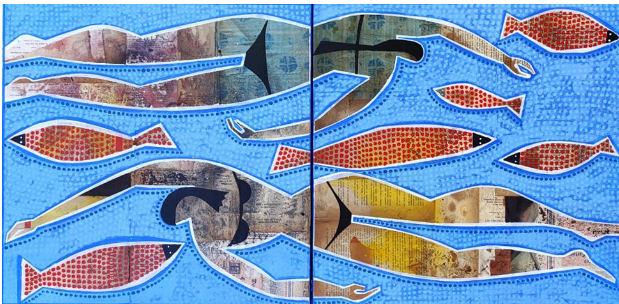
Nedadores (2021) 50x100 Tècnica mixta sobre tela