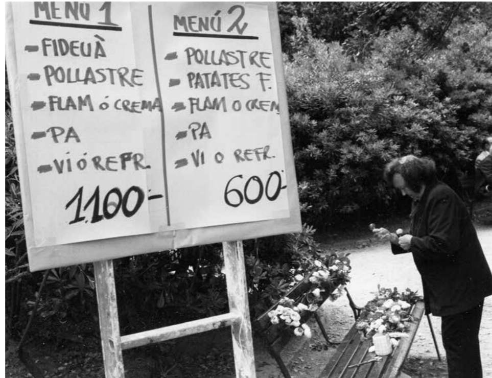
AUTOR: JOAN CORBERA

Una part dels veïns que passaven pel Parc i veïen els ornaments no en coneixen la motivació. I d'altres, sota els efectes dels rumors, ho atribuïen a una "dona del barri que no estava massa bé". Tanmateix, d'altres sembla que es quedaren amb la idea que es tractava d'una imatge difuminada en una pedra que li recordava la Mare de Déu