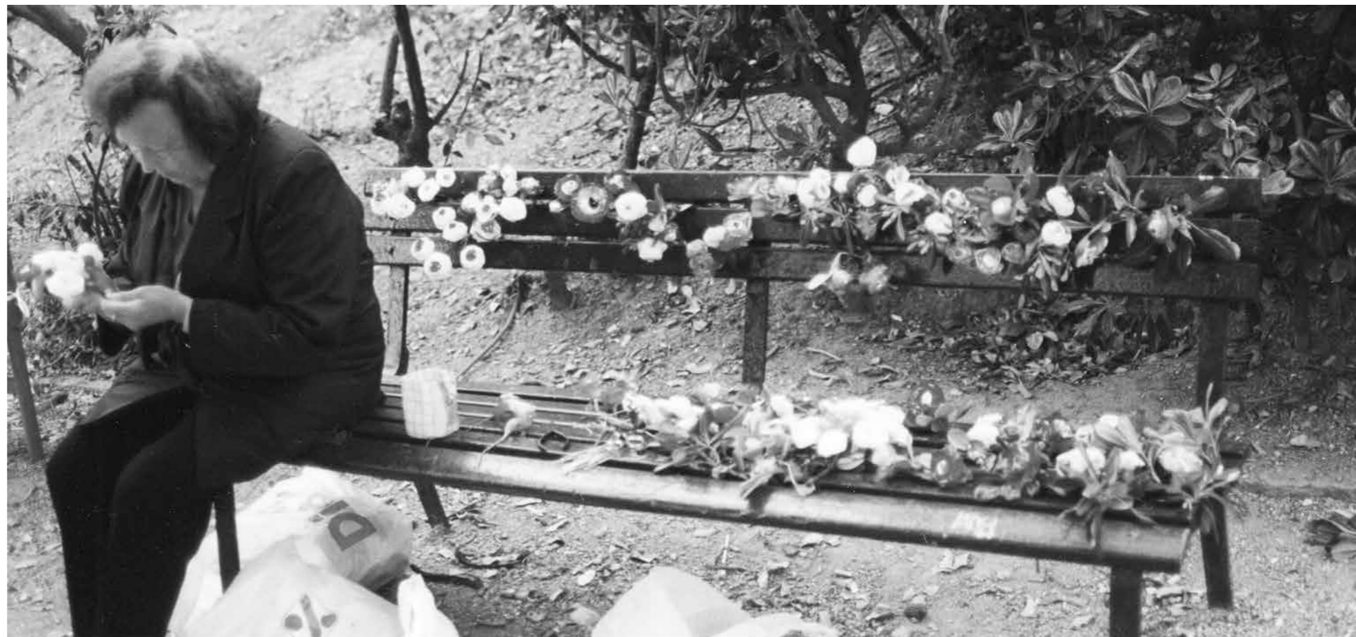
AUTOR JOAN CORBERA

També cal considerar que es disposa d'unes fotografies realitzades a finals de la dècada dels noranta, potser l'any 2000