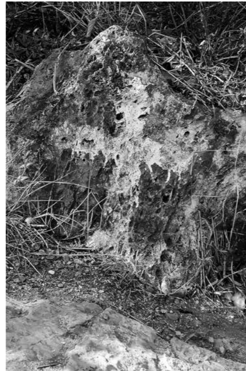
AUTOR: JORDI ARDANUY

neixement absolut dels fets, malgrat les amables respostes rebudes en quasi tots els casos. D'altra banda, i com s'ha dit, no es té pràcticament constància de les seves activitats ni es disposa de material documental, tret de les fotografies esmentades. Potser la localització de la seva filla, podria portar més llum sobre els fets.