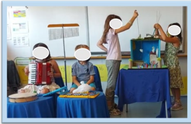
Figura 2. Representació de “La rínxols d’or” (alumnes de 2n A, curs 2022-23, CEIP Turó de can Mates, S. Cugat del Vallès).

Una altra activitat transversal que connecta la música amb altres àrees és la creació de fons instrumentals a refranys i obres pictòriques. En el primer cas, es pot musicar un poema de Joana Raspall ( La rosa , 2018) en motiu de la festa de Sant Jordi. Per representar el text corresponent: