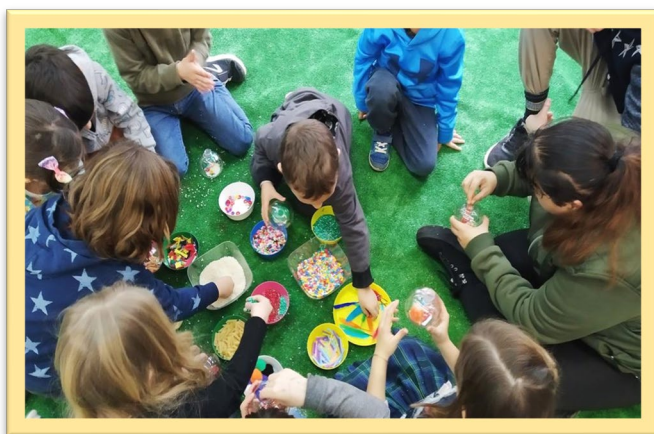
Figura 4. Procés de construcció d'ampolles multi sensorials amb els alumnes de de la Fundació Catalònia i els de 1r del CEIP Turó de can Mates (S. Cugat del Vallès).

En la línia del nostre treball, un projecte que treballa el timbre musical en la configuració d'ambients sonors és el " Taller d'ampolles multi sensorials " que han dut a terme els alumnes de 1r de l'escola Turó de can Mates i els de la Fundació Catalònia ( https://www.cataloniefundacio.cat/ ). Consisteix en la creació conjunta d'un treball plàstic realitzat amb ampolles i diferents materials sonors i plàstics que s'utilitzen per musicar diferents paisatges sonors, com el bosc, l'univers, la selva, el mar, etc., evocant emocions de calma, diversió, fascinació, bellesa... És doncs, un projecte social que genera vincles emocionals amb infants i persones amb discapacitat intel·lectual amb risc d'exclusió social, a través de la música. A continuació presentem dues imatges del procés de construcció (figura 4) i del resultat final (figura 5) que van realitzar aquests alumnes.