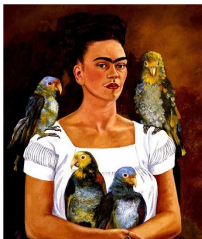
Figura 3. Me and my parrots (Frida Kahlo, 1941).

En el segon cas, es pot musicar el quadre de la pintora Frida Kahlo ( Frida and parrots , 1941) utilitzant diferents sons tímbrics per caracteritzar els diferents personatges del quadre, com les flautes d’èmbol i flautins per representar el cant dels ocells.