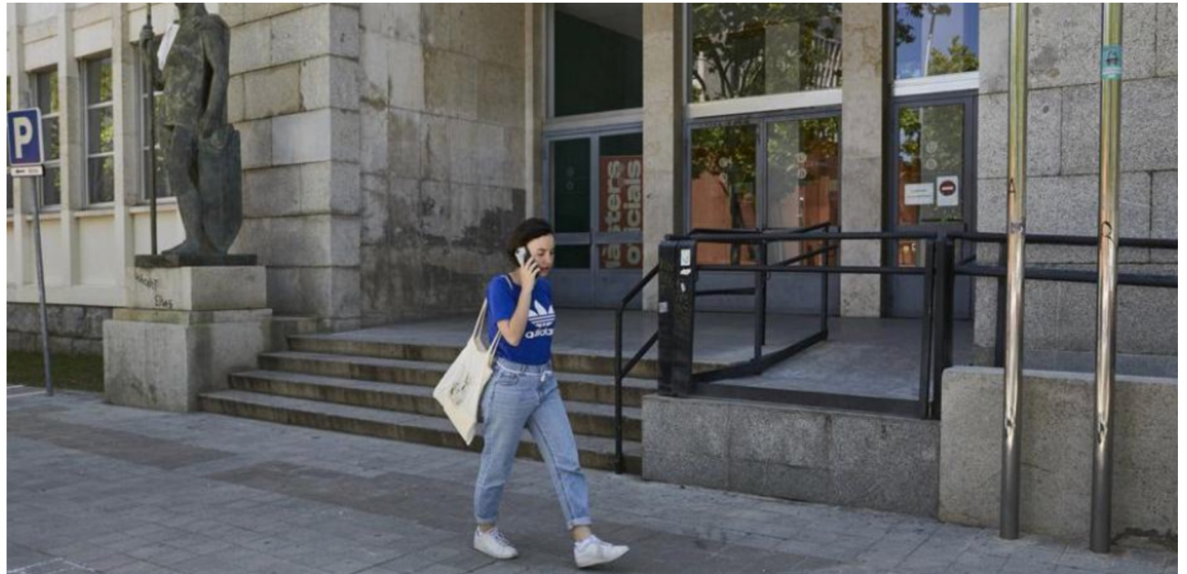
La Facultad de bellas Artes de Barcelona (César Rangel)

La Vanguardia [redacció] . Los decanos de Bellas Artes cargan contra el proyecto de Ley de Enseñanzas Artísticas Superiores [enllaç]