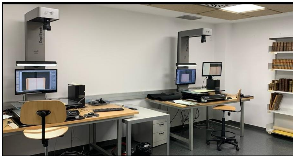
Fig. 3: detalle de una de las salas del Centro de Digitalización de la Universidad de Barcelona.

En cuanto al BiPaDi , se creó en 2014 para la difusión exclusiva de copias digitales del patrimonio de la Universidad. El desarrollo de la interfaz del portal fue limitado, siendo posiblemente un área pendiente de mejora para el CRAI, en cualquier caso, en la fase inicial del proyecto, se consideró menos relevante respecto a otros aspectos técnicos. Es importante destacar que el portal se diseñó pensando en una divulgación