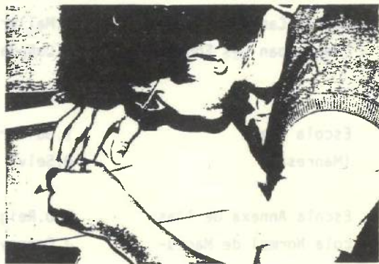
Butlletí de Mestres número 206

Això no té res a veure amb els possibles butlletins d'escola que, raonablement, correspon d'editar a claustres i «apas» per tal d'estimular qüestions d'organització i funcionament dels centres, i de notificació i constància d'ordre de règim intern o de previsions i calendaris d'activitats. En aquest sentit, i amb la corresponent separació visual, aquest butlletins poden ser inclosos en les publicacions pròpiament anomenades d'escola reservades a l'expressió dels alumnes. ●