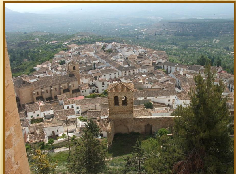
VÉLEZ BLANCO, DESDE EL CASTILLO

Fuente: http://commons.wikimedia.org/wiki/File:V%C3%A9lezBlanco.JPG