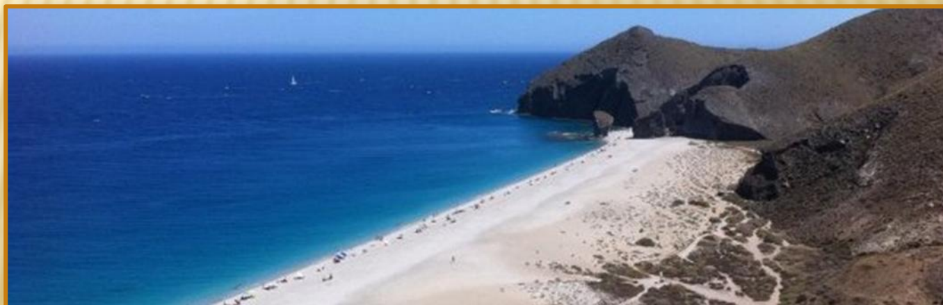
PLAYA DE LOS MUERTOS PARQUE NATURAL CABO DE GATA-NÍJAR