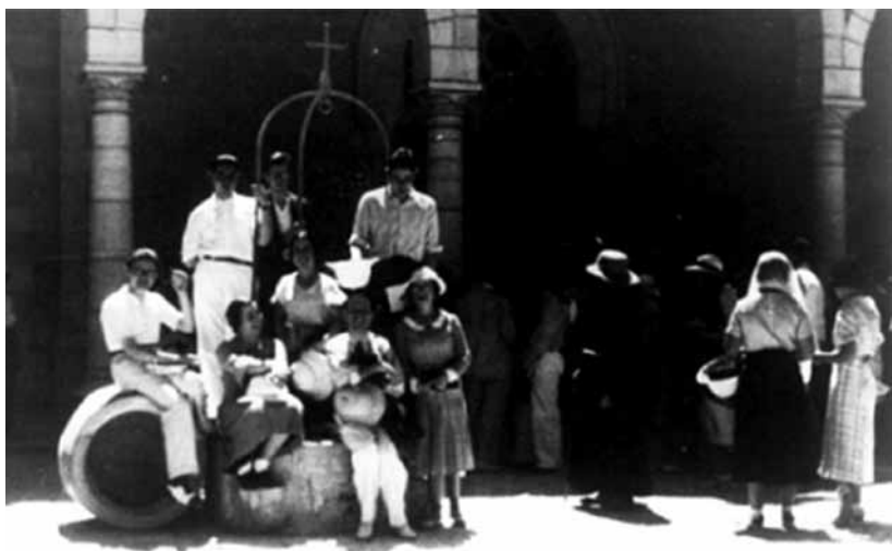
Creuer per la Mediterrània de 1933. El grup d'amics catalans al pou del pati de l'església del Sant Sepulcre a Jerusalem.