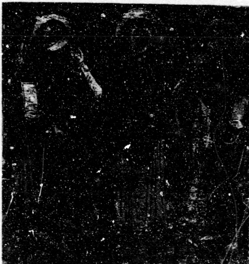
Fig.11.Assumpció.Barcelona, M.N.A.C., frontal de Sant Romà de Vila.