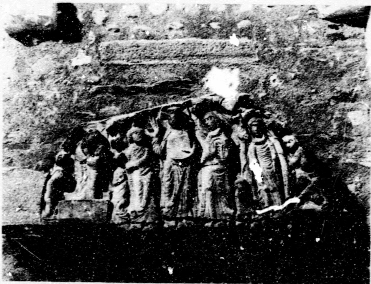
Fig.4.Resurrecció, Lliurament del cínfol,Glorificació, Assumpció. Cabestany, esg. parroquial.