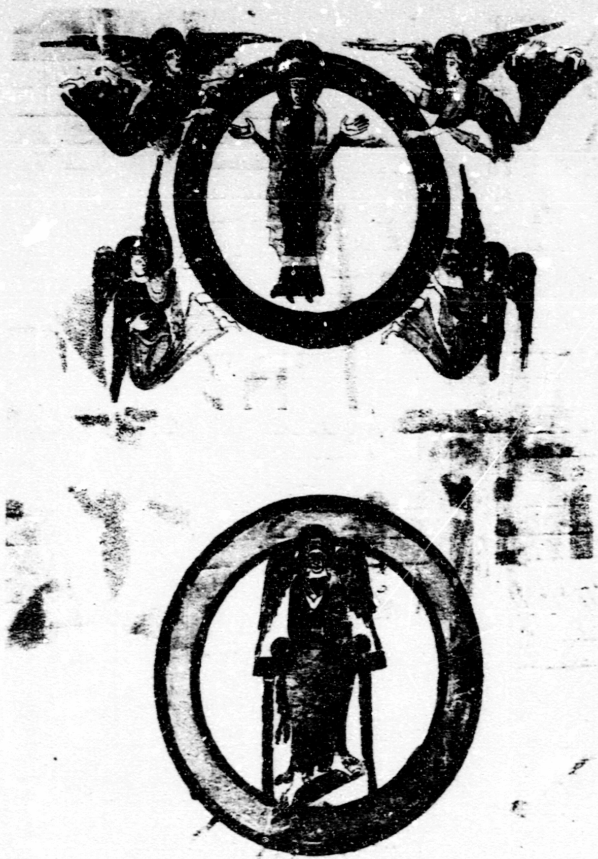
Fig.2. Glerificació.Roma, Bib. Vaticana. Bíblia de Ripoll.