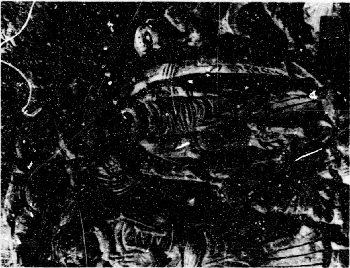
Fig. 5. Asumpeió. Cabestany, eng. parroquial.