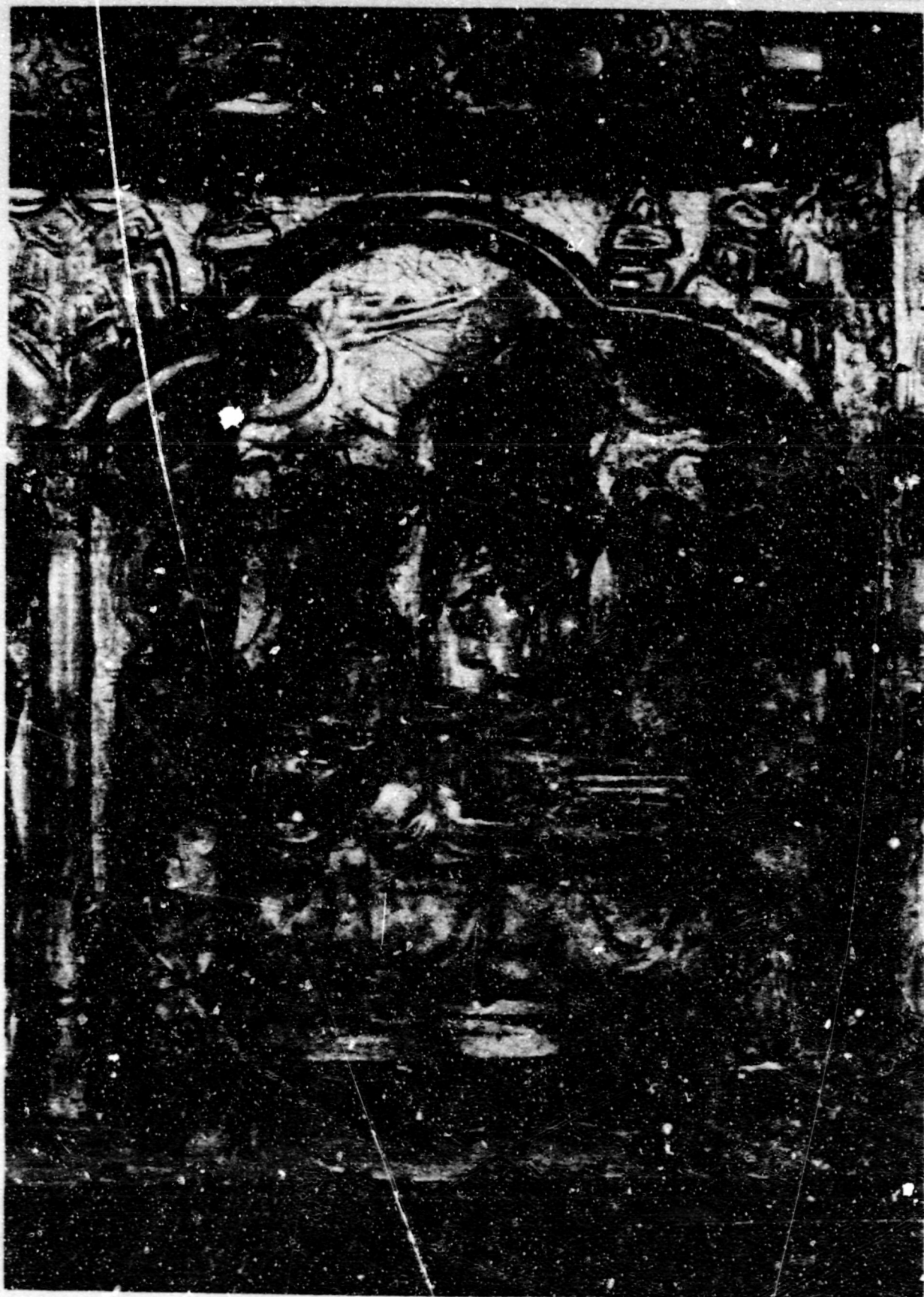
Fig.10.Dormició. Torí,M. Civico, frontal de Sant Cugat del Vallès.