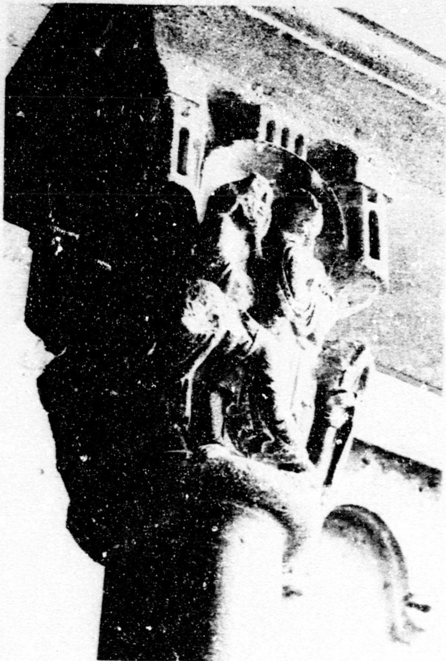
Fig.9.Dormició.Sant Cugat del Vallès, capitell del claustre.