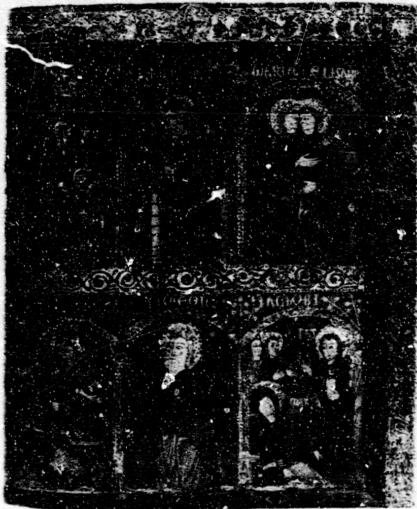
Fig.7. Dormició. Barcelona, M.N.A.C. Frontal de Mosoll.