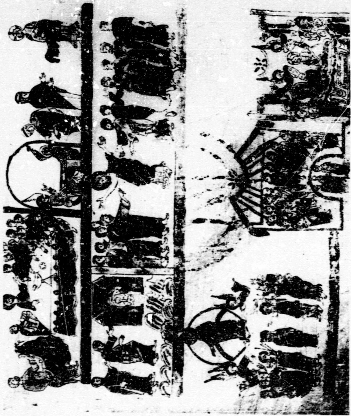
Fig. 1. Dormició. Roma, Bib. Vaticana. Bíblia de Ripoll.