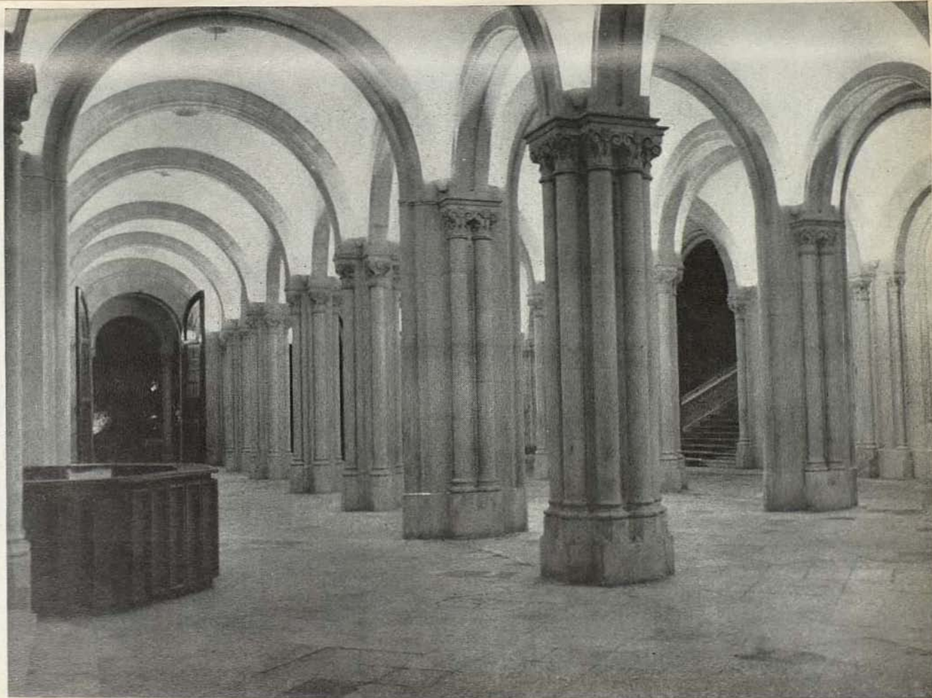
Vestibulo principal del edificio central de la Universidad.