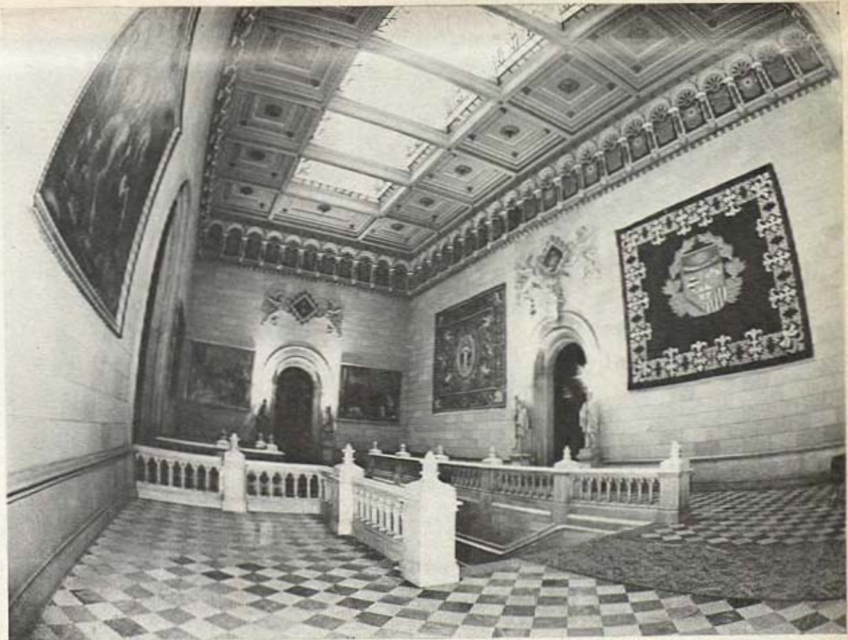
Vestíbulo del Rectorado.