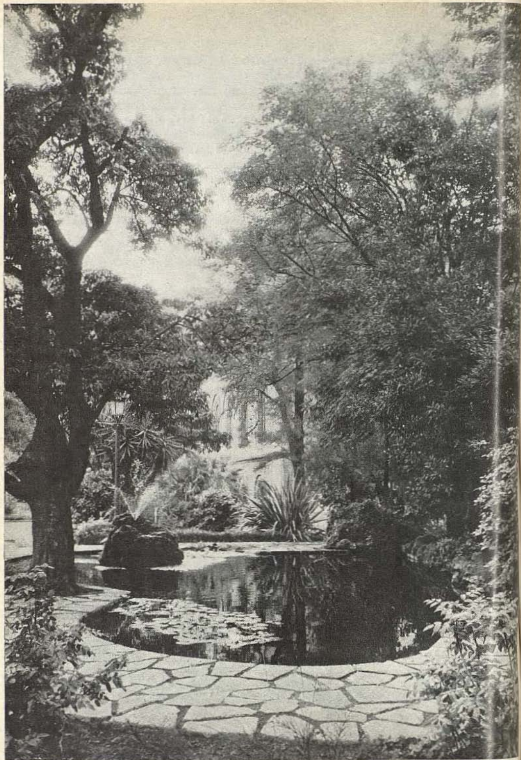
Vista parcial del jardín de la Universidad, abierto recientemente por vez primera al público.