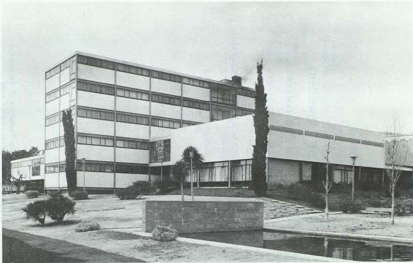
Aspecto de la Facultad de Derecho, situada en la Zona Universitaria de Pedralbes.