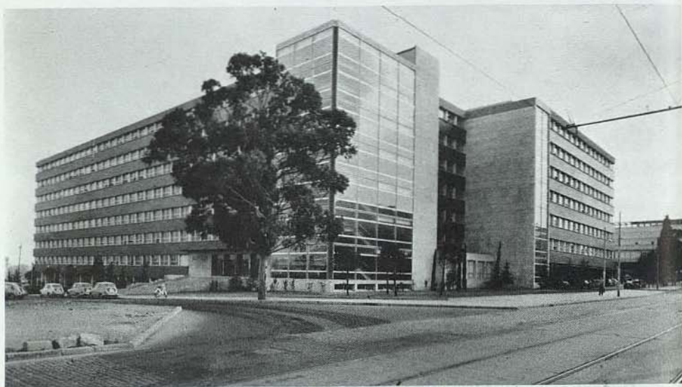
Aspecto del Edificio de las Facultades de Química y Física en la Zona Universitaria de Pedralbes.