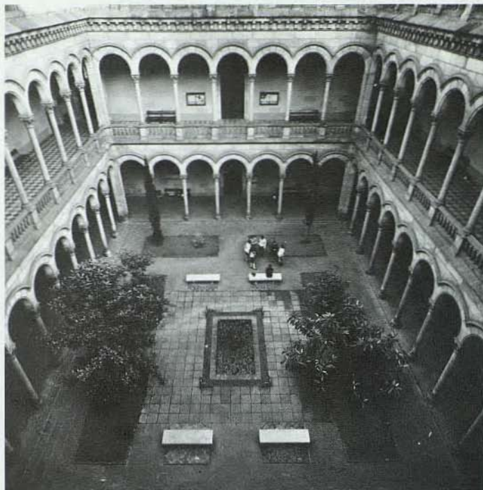
Patio del Edificio Central de la Universidad de Barcelona que alberga a las Facultades de Biología, Geología y Matemáticas.