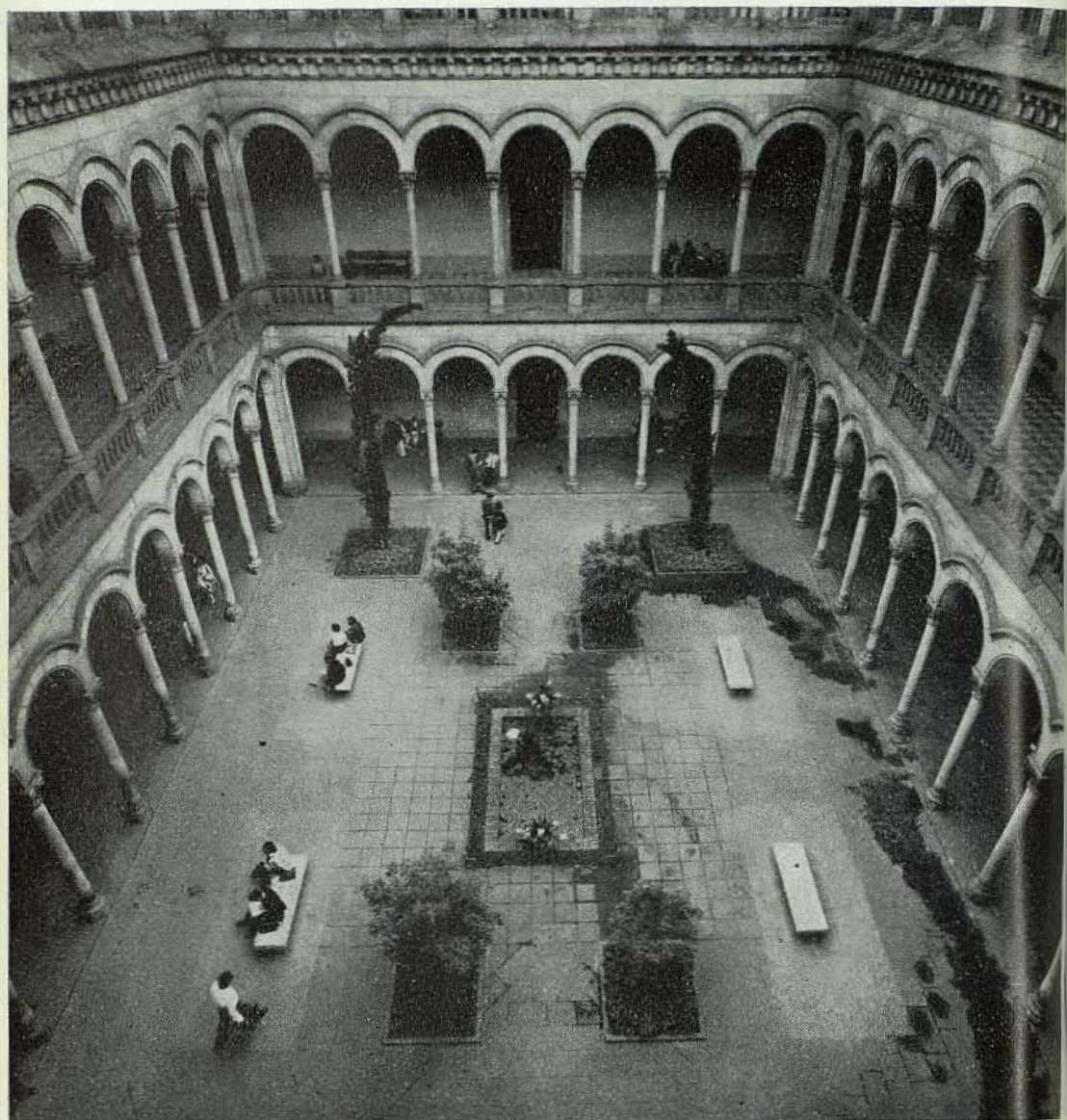
Patio del Edificio Central de la Universidad de Barcelona que alberga a la Facultad de Filosofía y Ciencias de la Educación.