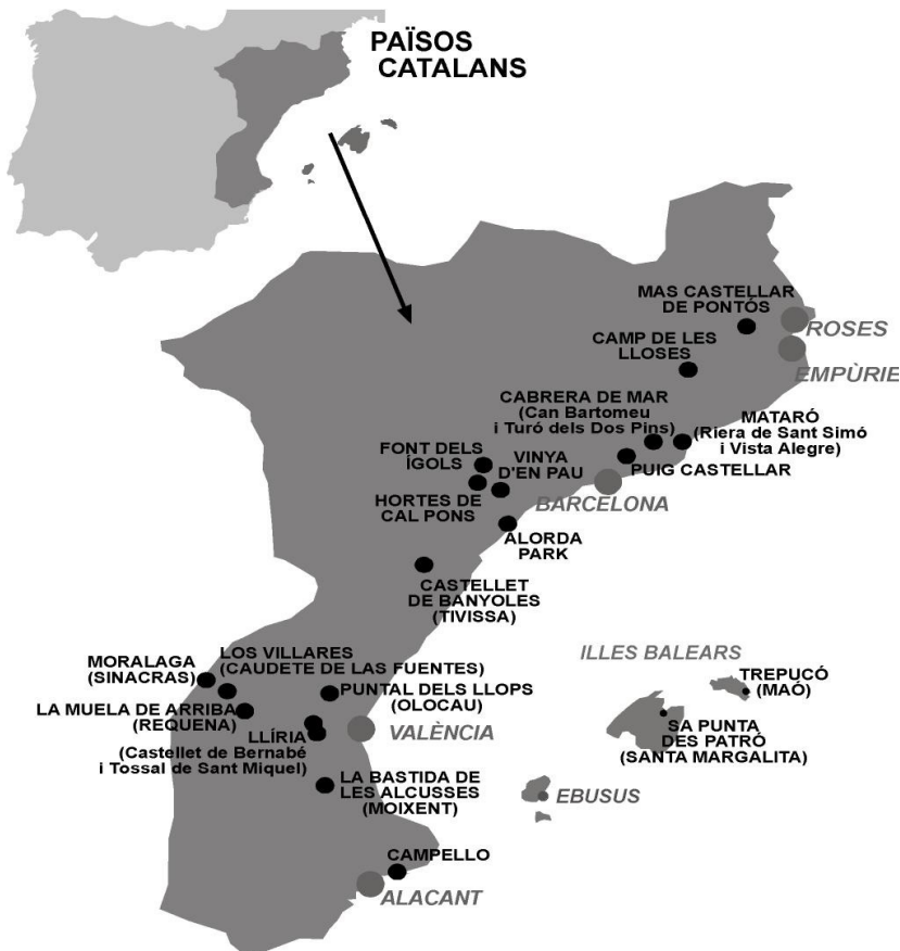
Figura 1.2.1.1: Mapa de la zona estudiada amb tots els jaciments estudiats indicats amb punts negres

punts del País Valencià (Edetania i Contestania) (Figura 1.2.1.1).