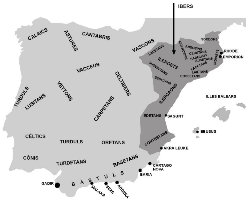
Figura 1.1.1.1: Mapa de la Península Ibèrica preromana

Hi ha hagut dos grans impactes a la Península Ibèrica (Figura 1.1.1.1) amb conseqüències molt importants en l'evolució de les societats indígenes, primer l'expansió comercial dels fenicis i després la dels grecs. La colonització va ésser un factor essencial per a l'establiment de la població en hàbitats permanents i la formació de "grups" de certa entitat com a resultat d'una nova economia, basada en la producció agrícola i en la