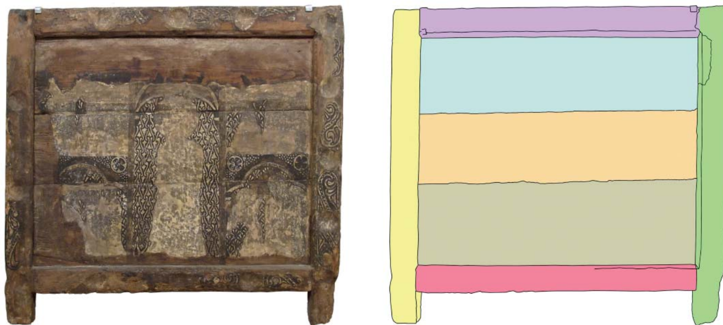
Figura 1. Anvers de frontal d'altar de Sant anònim (MEV 9708), segona meitat del s. XIII, procedent del Bisbat d'Urgell on excepcionalment es conserven les dues potes que servien per distanciar-lo lleugerament de terra i fixar-lo (esquerra). Esquema de l'anvers del mateix frontal: cada una de les peces independents que conformen l'estructura del suport es representa d'un color diferent (dreta).

El frontal d'altar és una taula rectangular de fusta amb un marc més gruixut que el plafó central que se situava de cara a la nau de l'església. En alguns casos s'acompanyava de dos laterals d'altar de la mateixa altura però de menys amplada. Tant el frontal com els laterals es policromaven. Es dedicaven a la figura de Crist, en forma de Pantocràtor, o a la figura de la Mare de Déu. A l'entorn d'aquesta figura central s'hi descrivien escenes de la vida d'un sant o una santa, el nom del qual sol donar títol a l'obra (Figura 1).