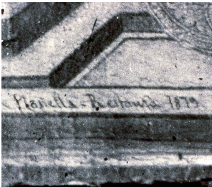
Figura 1. Firma del restaurador Alexandre Planella sobre una de les taules de la part baixa del Retaule de Sant Martí de la Catedral de Barcelona.

De l'Arxiu es van revisar de forma sistemàtica els llibres d'Actes capitulars i d'Exemplars de l'època estudiada, a més de les Caixes d'Obra de la Catedral on es veuen reflectides les decisions i activitats acordades pel Capítol catedralici a les seves reunions periòdiques. Les tretze caixes d'obra de la Catedral escorcollades, comprenen de l'any 1833 al 1900. Aquestes caixes contenen informació d'índole diversa: rebuts i factures de professionals que treballaven per la fàbrica, altres de proveïdors de materials diversos, i llibres de comptes amb conceptes varis. En el cas de l'Arxiu es va tenir en compte únicament el període que comprèn del 1850 al 1900, ja que a causa de les desamortitzacions del segle XIX no es conservava pràcticament documentació de la primera meitat del segle (Figures 1 i 2).