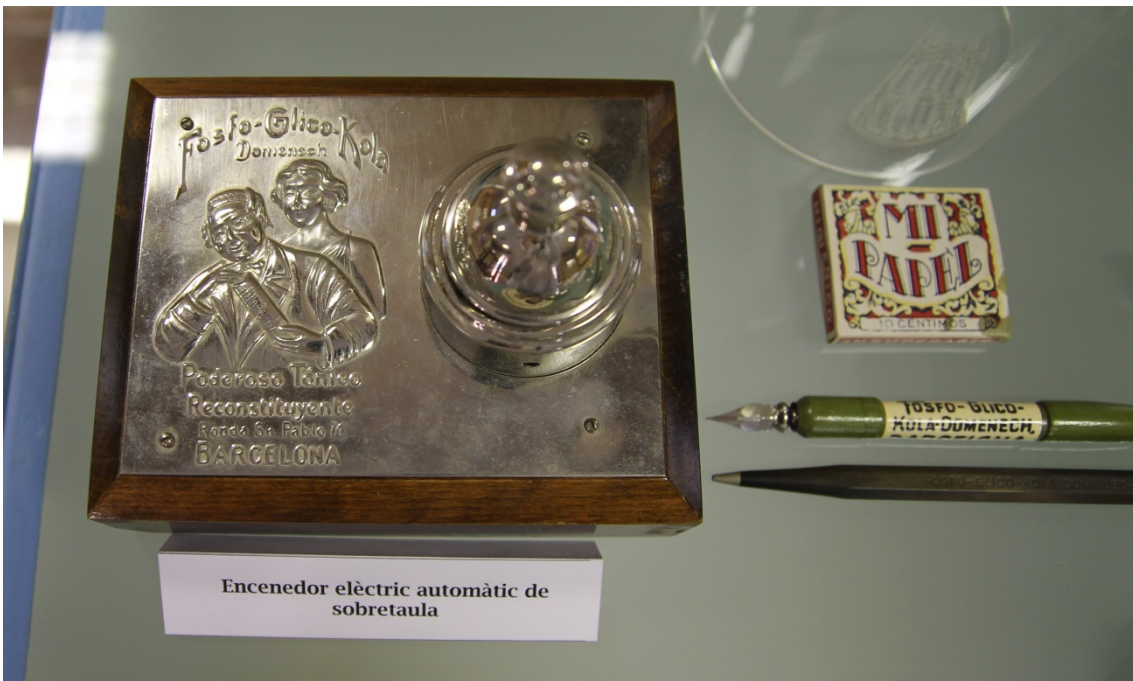
Encenedor elèctric automàtic de sobretaula