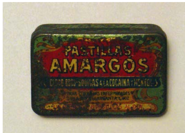
PASTILLAS AMARGÓS CLORO-BORO-SÓDICAS A LA COCAÍNA Y MENTOL

http://www.ub.edu/pharmakoteka/node/24858