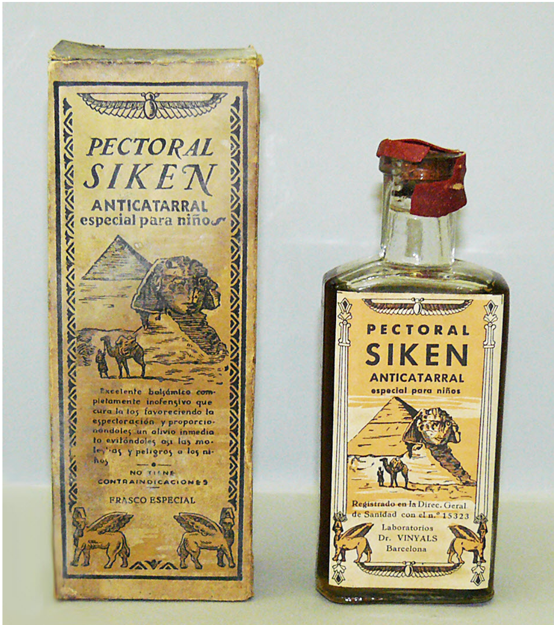
PECTORAL SIKEN (Niños)

http://www.ub.edu/pharmakoteka/node/24994