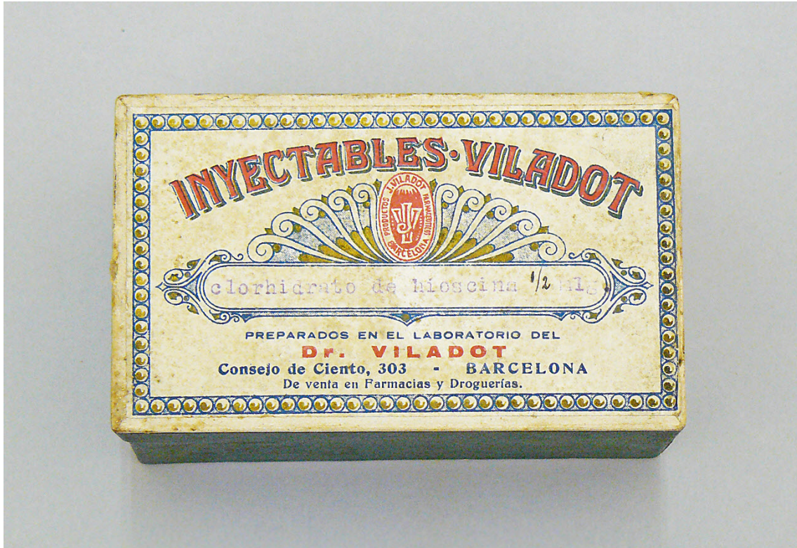
INYECTABLES VILADOT- CLORHIDRATO DE HIOSCINA

http://www.ub.edu/pharmakoteka/node/26630