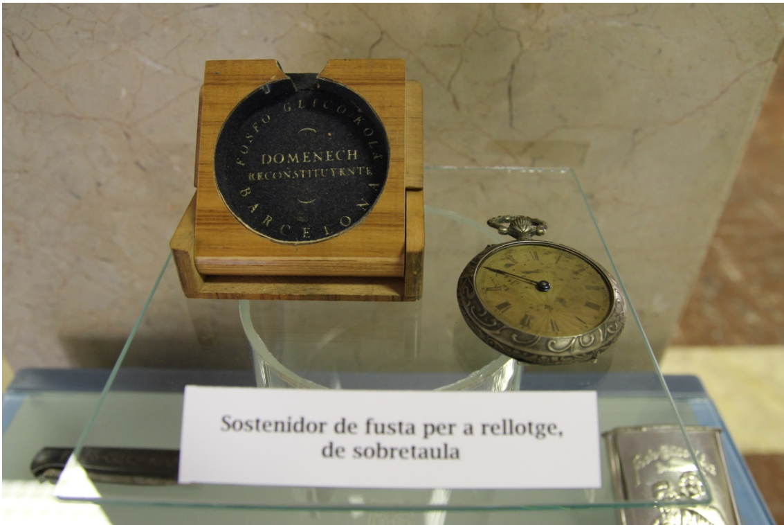
Sostenidor de fusta per a rellotge, de sobretaula