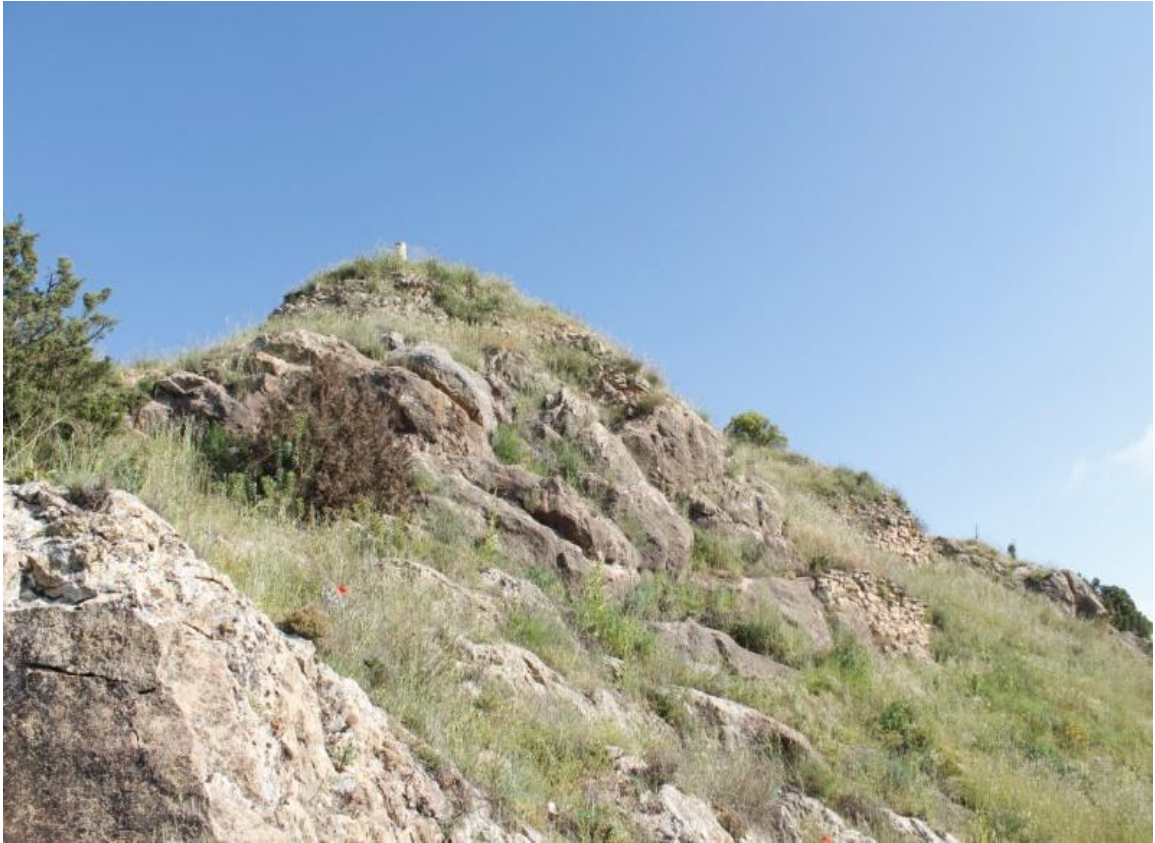
Ilustración 3 Castell de Montmagastre