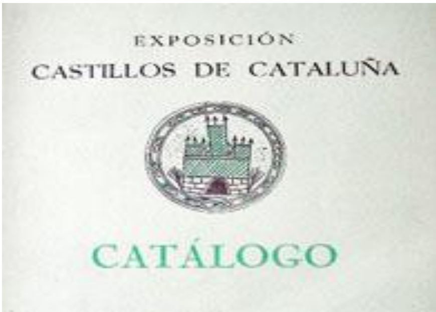
Ilustración 1 Fotografía de la portada del catálogo de 1959