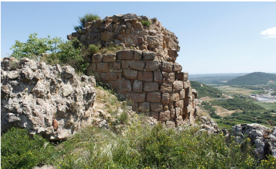
Ilustración 6 Torre del castillo de Ponts