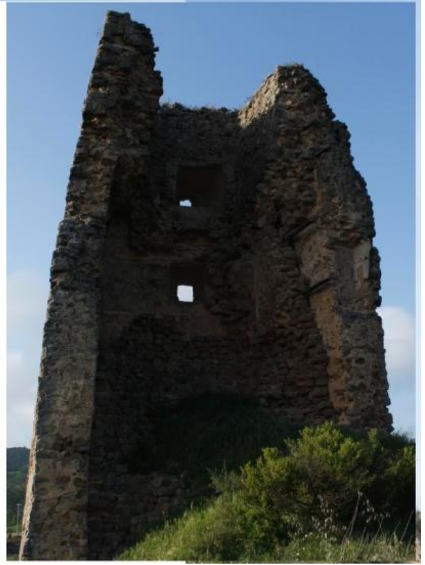
Ilustración 3 Torre de Lloberola