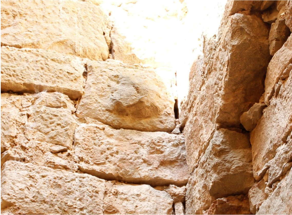
Ilustración 11 Sillar de la iglesia anexa a la Torre de Vallferosa