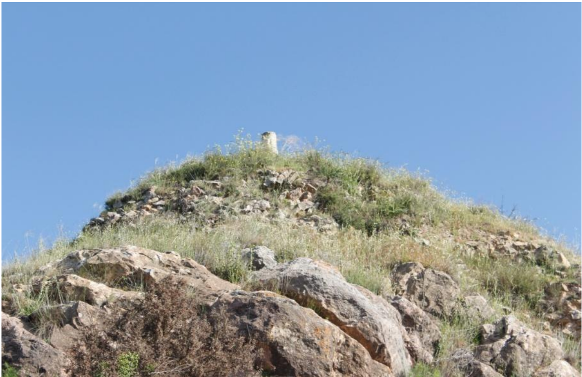
Ilustración 4 Detalle: Torre del Castell de Montmagastre