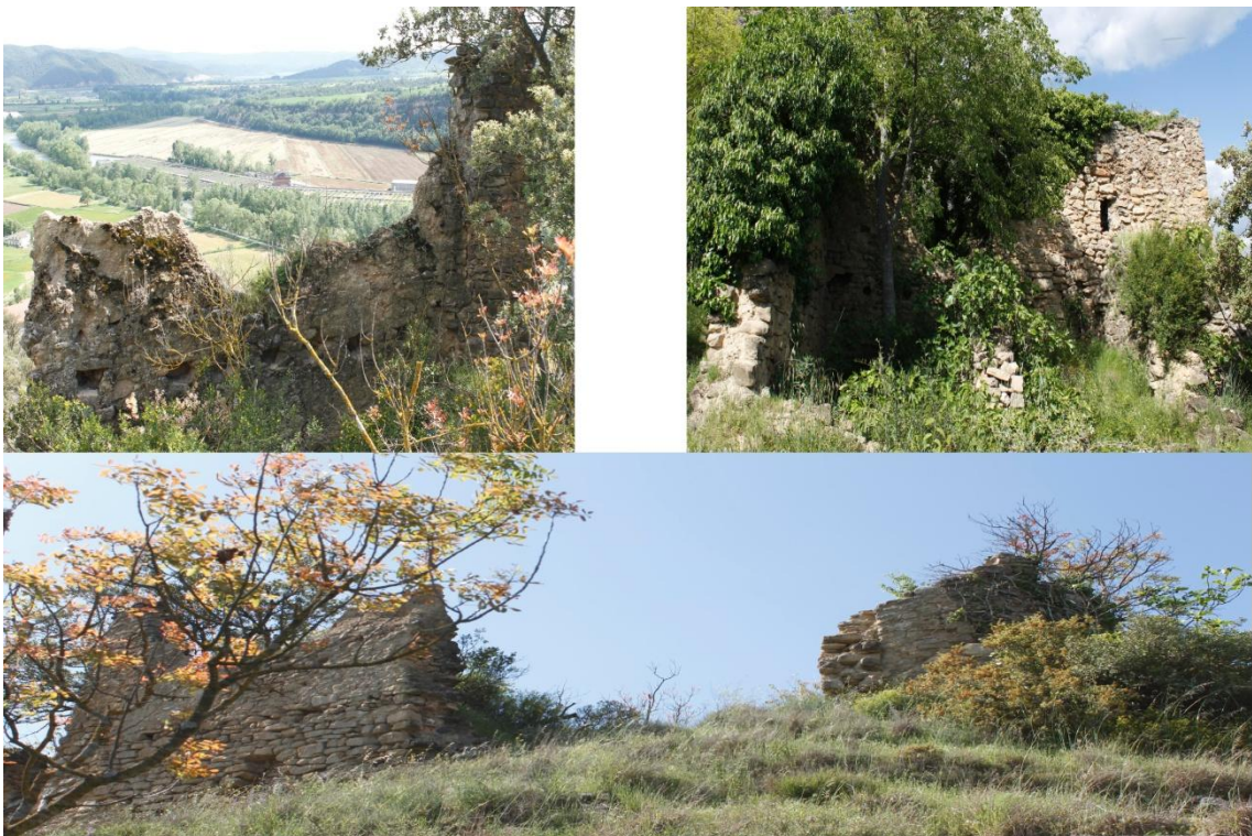
Ilustración 2. Fragmentos de la estructura de defensa de Oliana