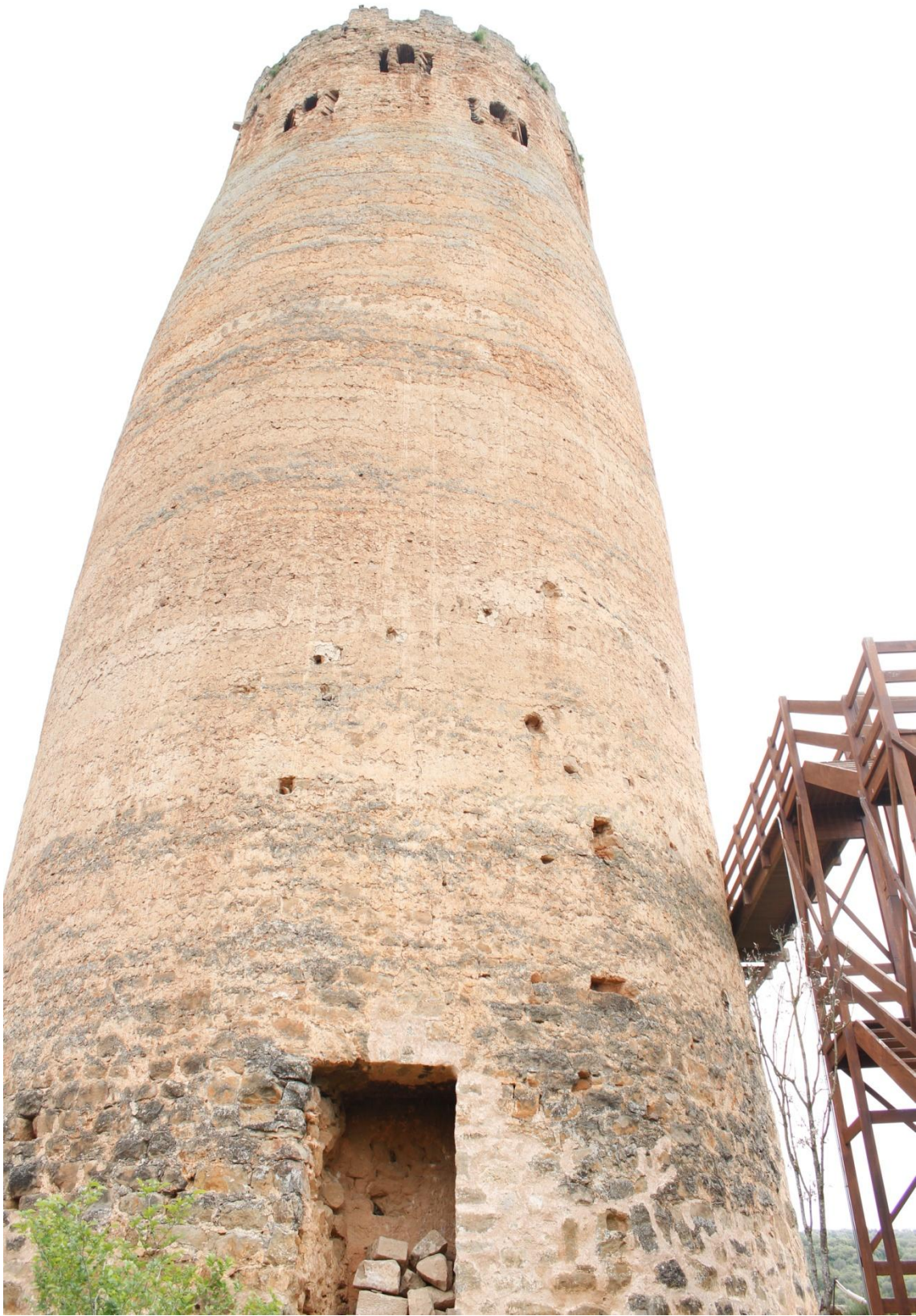
Ilustración 10 Torre de Vallferosa