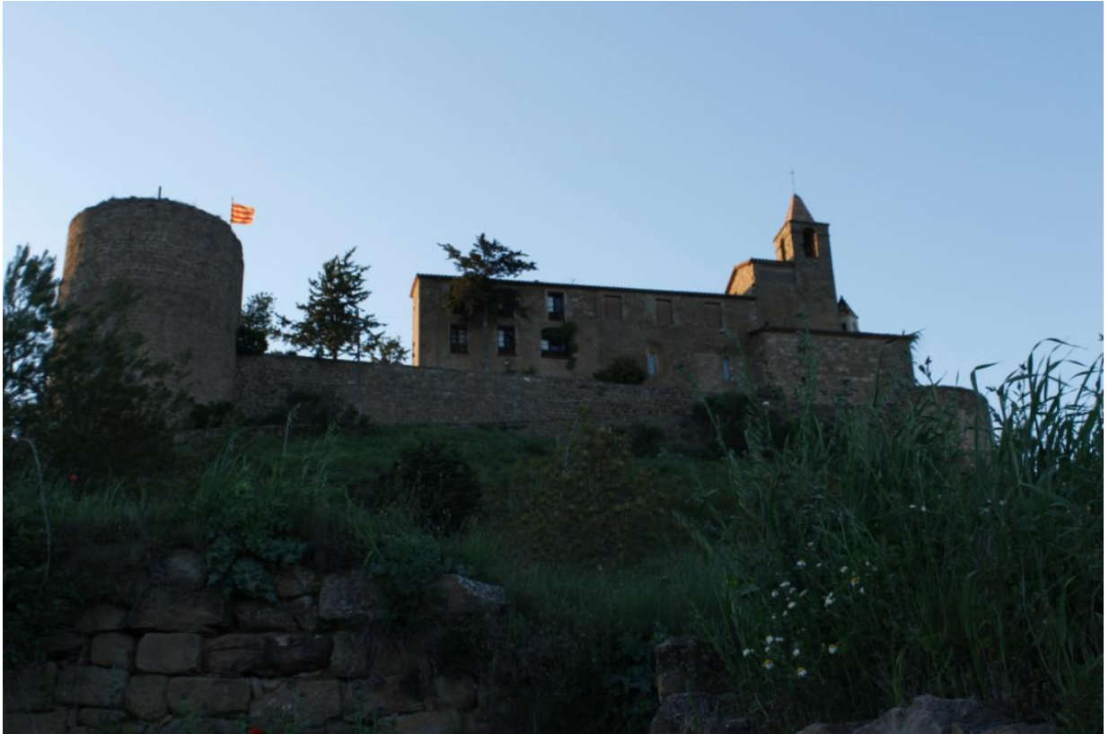
Il·lustració 7 Castellvell de Solsona