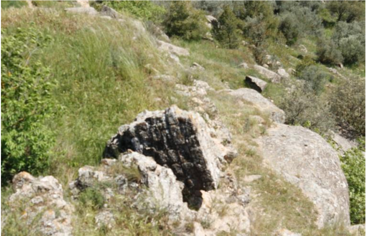
Ilustración 5 Posibles restos de la torre del Castell de Ponts