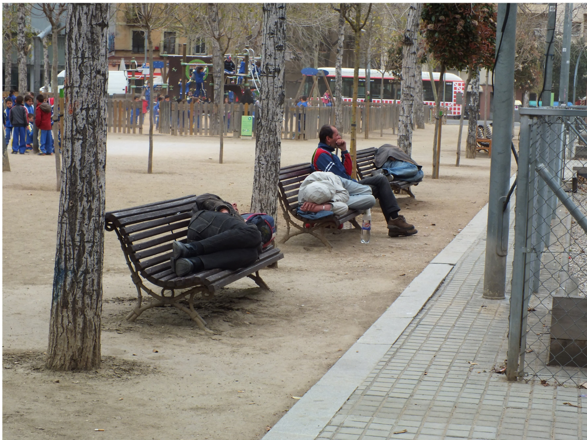
TÍTULO: Comunitat de Veins