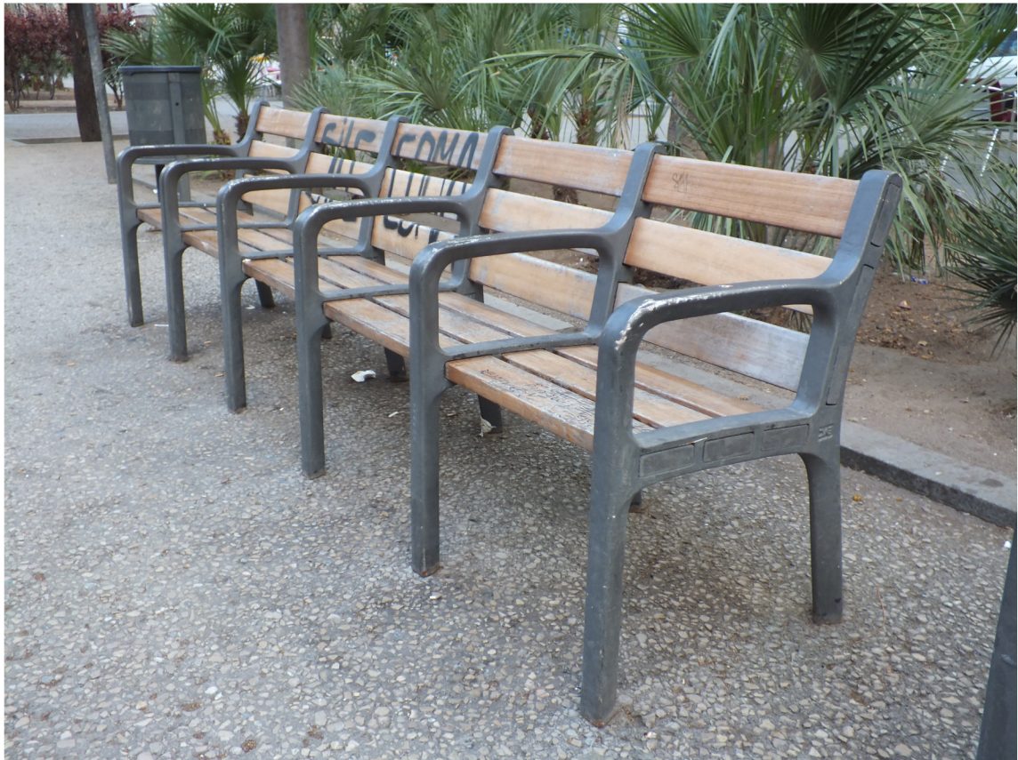
TÍTULO: La ciudad no quiere verme