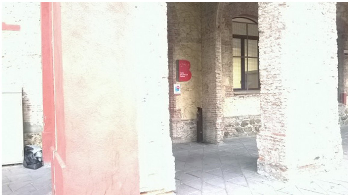
TÍTULO: Hotel para invisibles