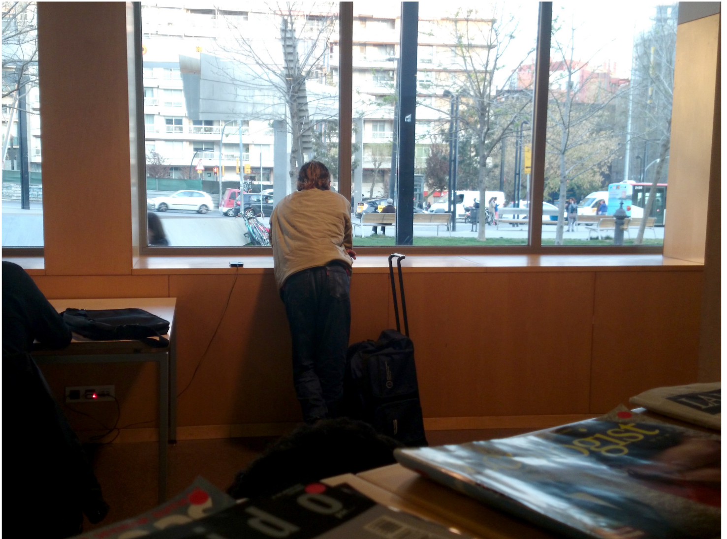
TÍTULO: IN/OUT Biblioteca Lesseps