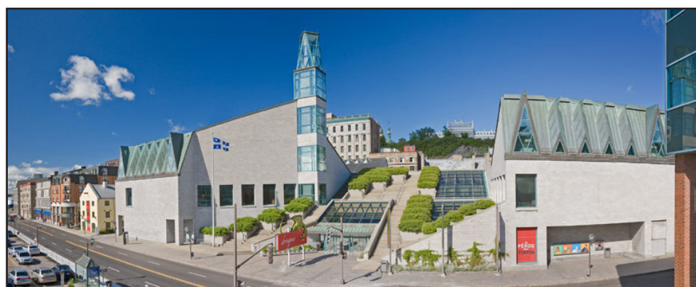
Museu de la Civilització del Quebec

Font: Un Museo Sostenible, de Georgina DeCarli (2004)