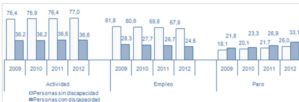
Figura 1. Evolución de las tasas de actividad, empleo y paro entre los años 2009 y 2012.

Analizando la evolución de las tasas de actividad, empleo y paro entre los años 2009 y 2012, observamos que las tasas de actividad de las personas sin discapacidad 2 han crecido ligeramente, mientras que se mantienen en el caso de las personas con discapacidad. En cambio, las tasas de paro han sufrido un incremento mayor en el grupo de personas con discapacidad (12%) frente al experimentado en el caso de las personas sin discapacidad (7%) (Figura 1).