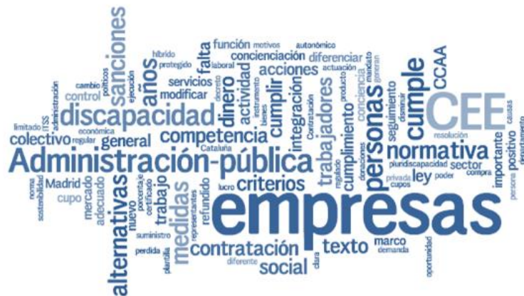
Figura 3. Nube de tags de los términos surgidos en las entrevistas

Presentamos, de forma visual, la nube de tags de los conceptos más significativos de las entrevistas realizadas.