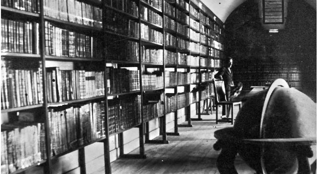
La biblioteca del Convento de San Lorenzo.