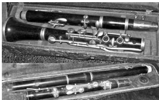
La biblioteca conserva piezas históricas únicas, entre ellos instrumentos musicales.

La mencionada biblioteca-archivo conserva cartas personales escritas, enviadas, y recibidas, por los frailes establecidos en reducciones y misiones indígenas. En esas cartas, reflexionaron sobre su