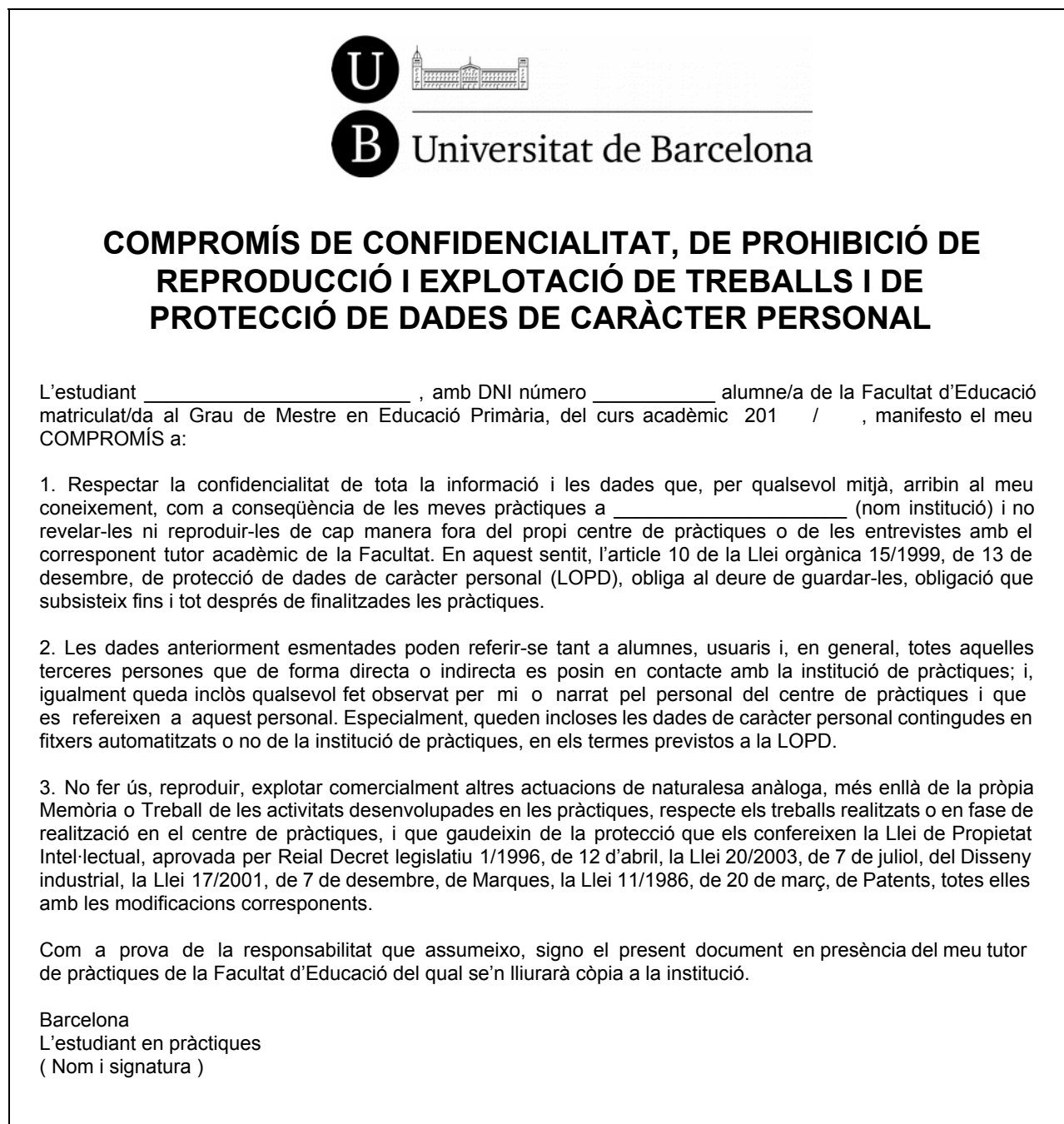
Figura 5: Document de Compromís de Confidencialitat

L'estudiant ha de vetllar per garantir el dret a la pròpia imatge dels alumnes de l'escola on faci pràctiques i en cap cas pot incloure dades de caràcter personal en els treballs i portafolis que elabori durant les Pràctiques 1. Alguns centres formadors demanen que l'estudiant signi un compromís de confidencialitat. Hi ha un model de document de "COMPROMÍS DE CONFIDENCIALITAT, DE PROHIBICIÓ DE REPRODUCCIÓ I EXPLOTACIÓ DE TREBALLS I DE PROTECCIÓ DE DADES DE CARÀCTER PERSONAL" que es pot descarregar de l'espai documentació.