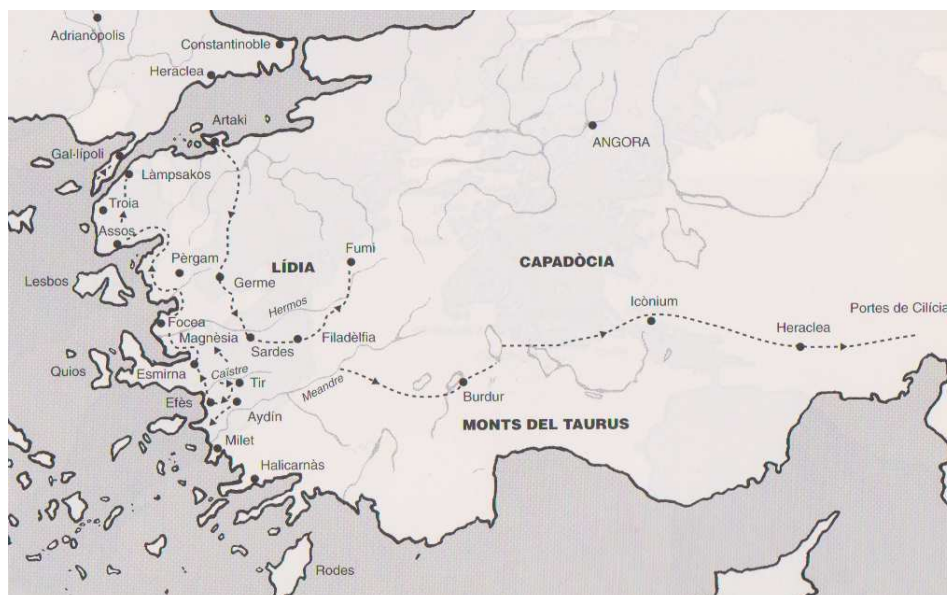
Annex 2: Teatre d'Operacions dels almogàvers a Anatòlia i Tràcia