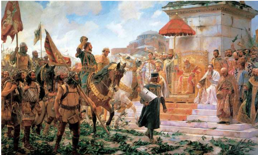
Annex 5: L'entrada de Roger de Flor a Constantinoble. Quadre de Moreno Carbonero al Palau del Senat a Madrid.