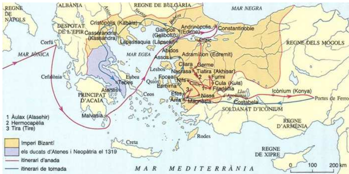
Annex 3: Itinerari del trajecte dels almogàvers per terres d'Orient.