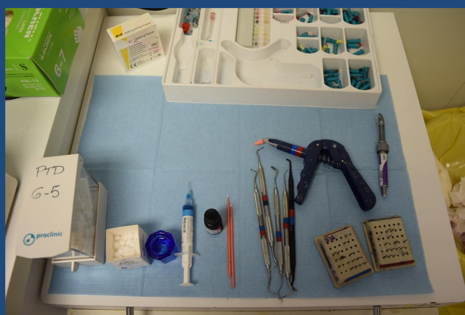
Fig. 1 Material preparado para la realización de la practica