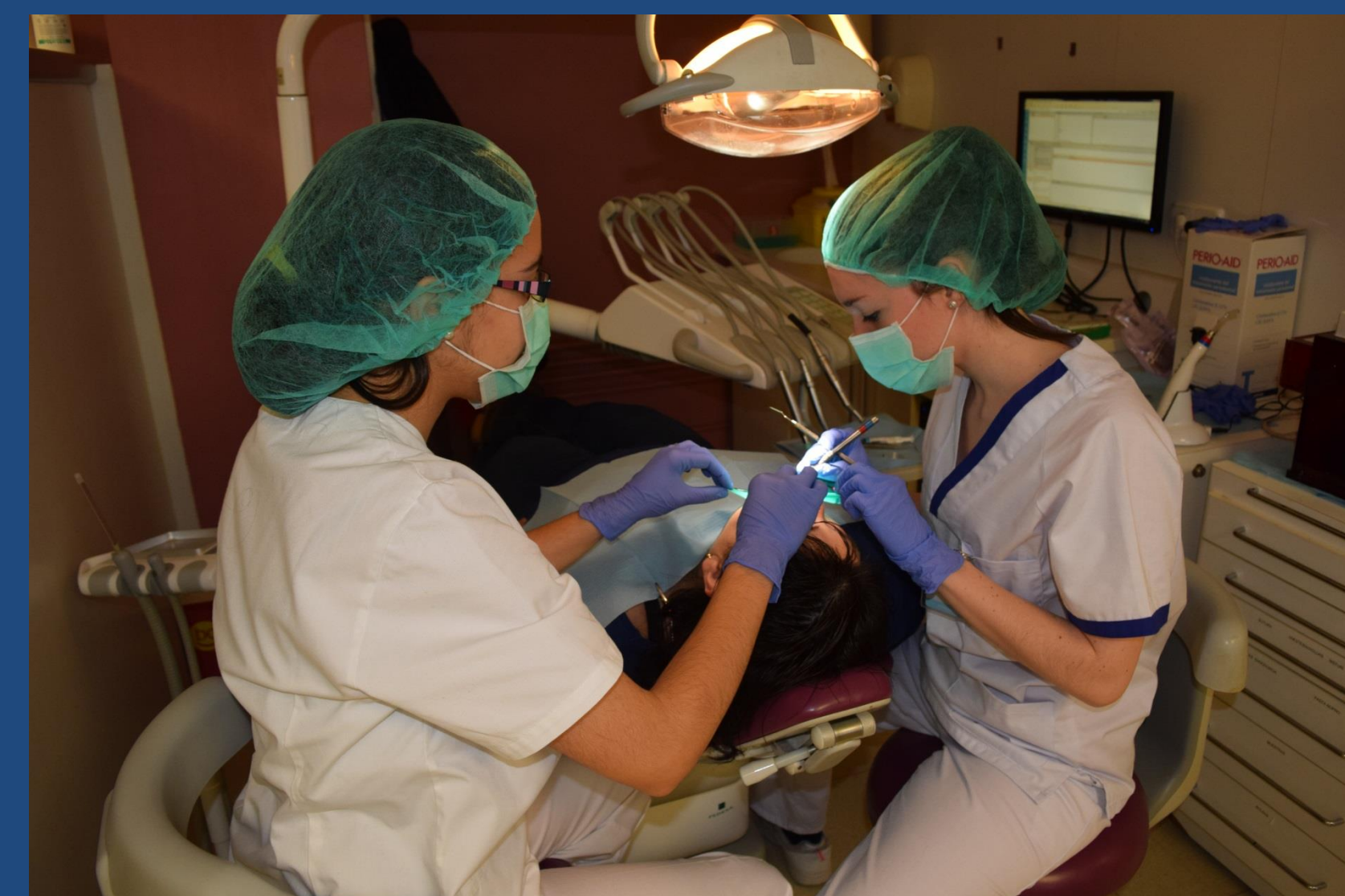
Fig. 3 Alumnos realizando una exploración clínica a un paciente