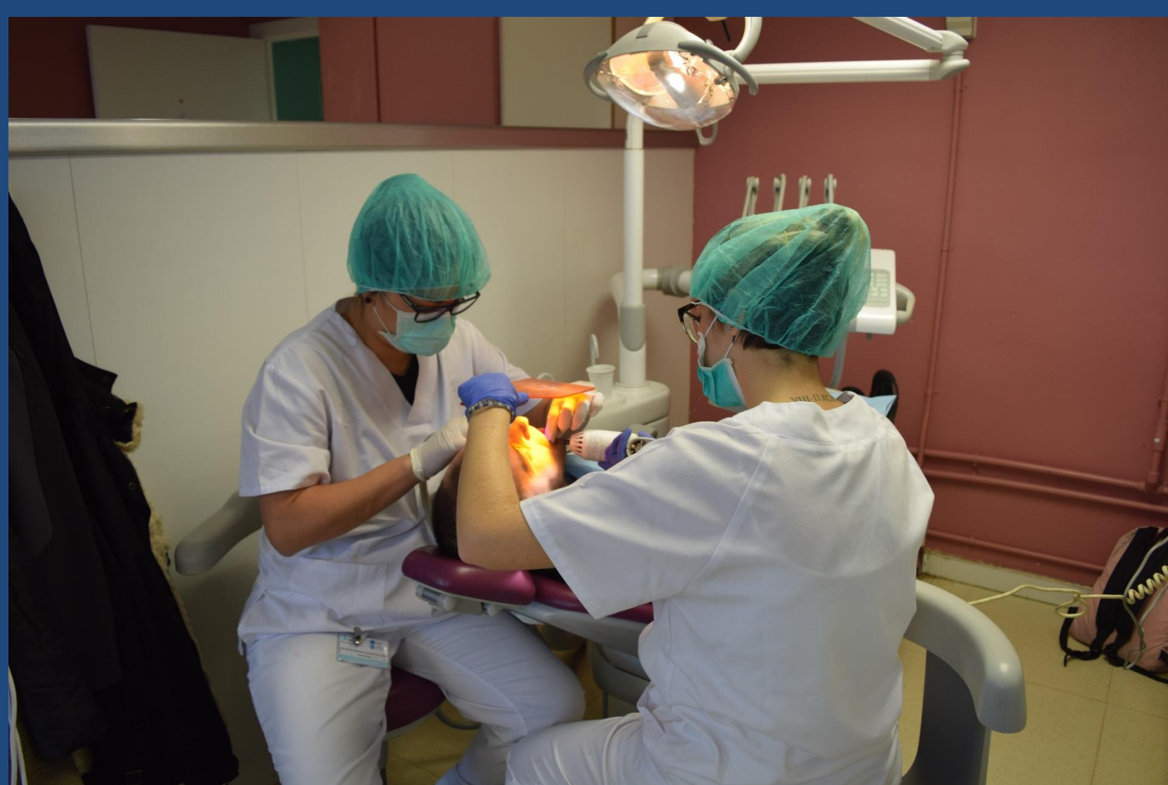
Fig. 4 Alumnos realizando un tratamiento restaurador a un paciente