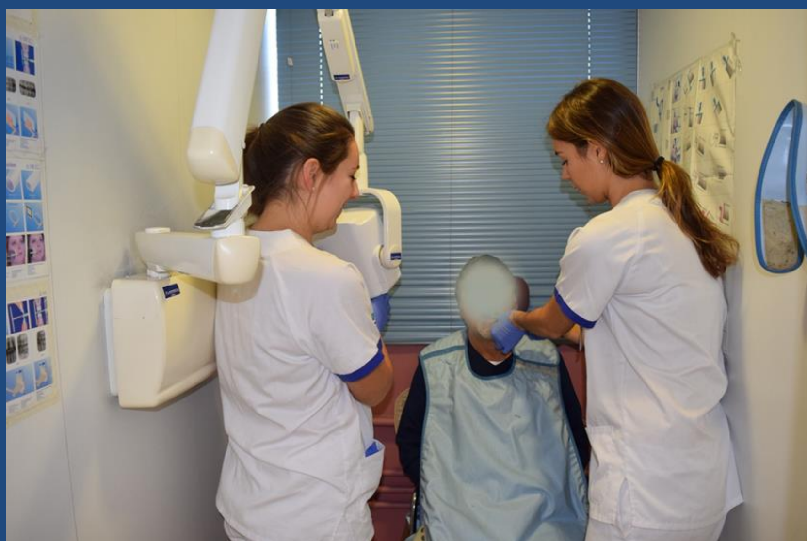
Fig. 2 Alumnos realizando una exploración radiográfica a un paciente

MATERIAL Y MÉTODO: Para la realización del estudio hemos diseñado una encuesta con diez preguntas en las cuales se valora desde las instalaciones, personal auxiliar, profesorado, materiales, agenda de visitas, programa informático, opinión individual pre-prácticas, post-prácticas y en comparación con otras universidades. Cada una de las preguntas podía valorarse con tres respuestas: 1Excelente, 2Suficiente, 3Deficiente. La encuesta ha sido contestada por 68 alumnos de forma anónima.