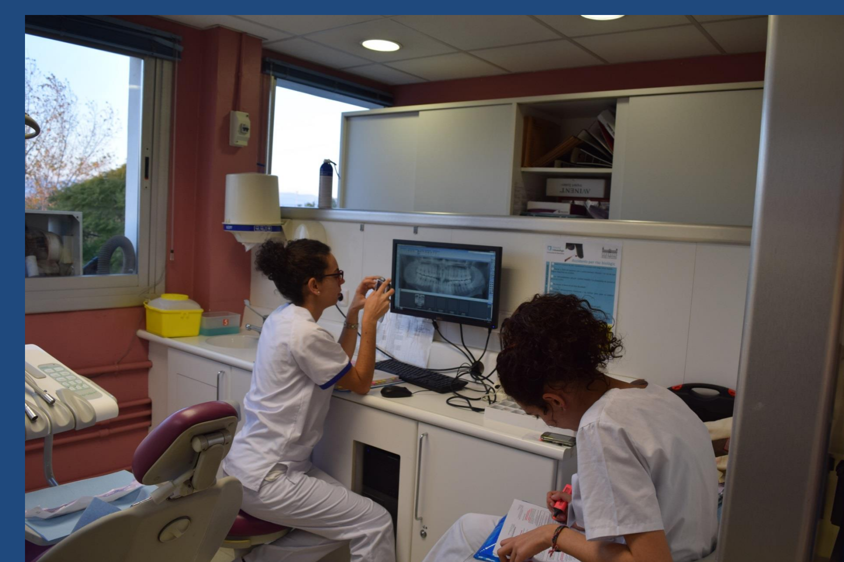
Fig. 5 Alumnos estudiando las pruebas complementarias e historia clínica de un paciente

RESULTADOS: La media de los valores obtenidos se sitúa entre 1,47 y 2,62.