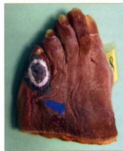
Fig. 5. Marcado externo con bario del contorno de la lesión.

tisulares y sobre todo no infiltraba a la cápsula articular y por tanto no afectaba en absoluto a ninguno de los componente articulares, ni al tejido cartilaginoso, ni al óseo (Fig. 7-8)