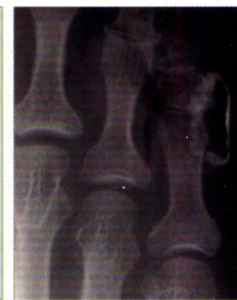
Fig. 6. Radiografía de comprobación del marcaje.