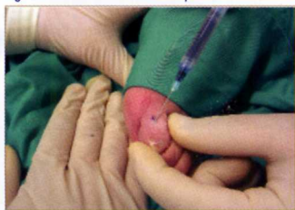
Fig. 4. Lateralización de la aguja para infiltrar en abanico.