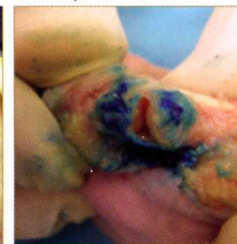
Fig. 8. Observación de la distribución del producto tras la disección de la articulación.