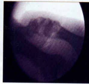
Fig. 1. Fluoroscopia y localización exostosis.