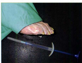
Fig. 2. Preparación del espécimen y tinto del PAAG.

lizarlo (Fig.2). Un punto importante del estudio preliminar consistía en comprobar que en los especímenes no se producía una diseminación y/o infiltración del gel a tejidos adyacentes, con la consiguiente alteración de los mismos.