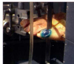
Fig. 9. Sección sagital del dedo.