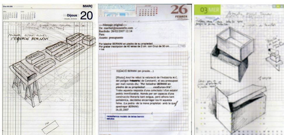
Figura 1. Salvador Juanpere Dietari de treball de l’artista , dins Lavorare stanca (2008). GaleriaNoMesArt, Girona.

Darrerament, la seva obra s’impregna d’un procés continu de reflexió sobre el fet artístic i els seus metallenguatges. Les reflexions al voltant de la pròpia feina extretes del Blog de treball (2009) de l’escultor, en diàleg amb l’assaig L’artesà (2009) de Richard Sennett, són el punt de partida d’aquest article.