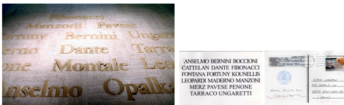
Figura 4. Salvador Juanpere Tributum (2011). Instal·lació. Arena de la pedra de Mèdol. Reial Acadèmia de Roma. Figura 5. Salvador Juanpere Tributum (2010). Postal enviada des de Roma. (Imatges cedides per l'artista.)

L'artista incorpora dins del seu vast horitzó referencial el paisatge romà de la seva terra natal que es dissol i, com un acte d'anhel, el captura mitjançant la paraula; però de nou la paradoxa de l'escultor deixa que el pas del temps l'esborri.