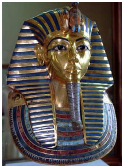
Imatge d'arxiu de la màscara de Tutankamon.

Un conservador no identificat va explicar que " desafortunadament " es va emprar un material irreversible, cola de la marca Epoxi, que solda resolutivament materials com la pedra i el metall però que sens dubte no és apropiat per a una obra d'art de primera categoria com la màscara de Tutankamon.