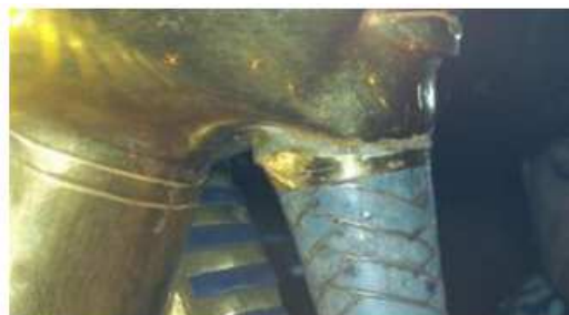
Imatge difosa a Twitter en la qual s'aprecia la cola i els danys causats a la màscara.

La màscara hauria d'haver estat portada al laboratori de conservació per analitzar el dany, però es va decidir, " des de dalt ", segons les fonts, esmenar el trencament immediatament per tornar a exhibir la peça, que és un dels grans atractius del museu.