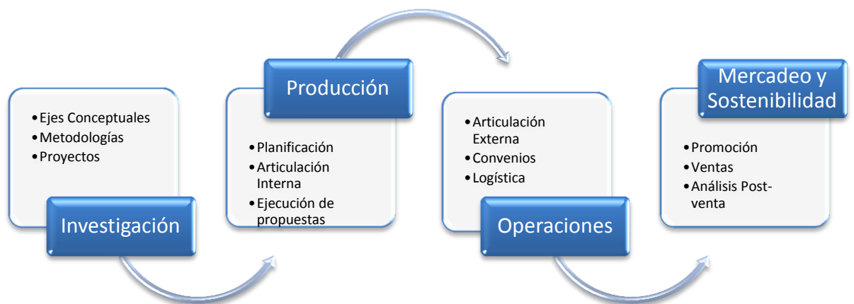
Cuadro No. 2 Procesos

Fuente: Fundación Quito Eterno. Elaboración: E. Guevara, 2013.