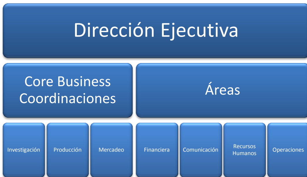
Cuadro 1. Organigrama y estructura funcional.

Fuente: Fundación Quito Eterno. Elaboración: E. Guevara, 2013.