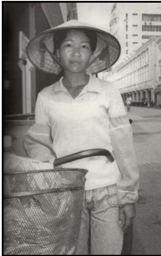
I. China, 2002.

“¿Por qué hay ricos y pobres? Los ricos quieren invertir y volverse cada vez más ricos, y los pobres son perezosos. “