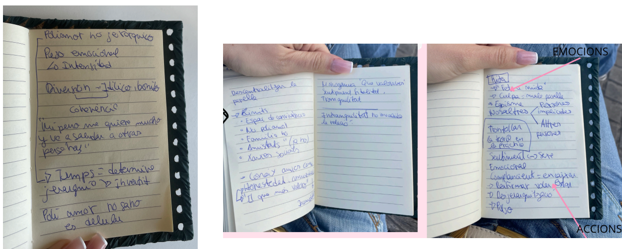
Imatge 1: Esquemes del diari de camp per la Taula 2 (entrevista Rita)

Diverses informants feient ús d'analogies i reflexions per donar-li sentit al seu discurs.