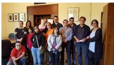
L’alumnat del curs de Capacitació d’auxiliars de serveis en una visita a la Gerència de la Universitat de Barcelona.

Del 3 d’abril al 21 de juny de 2018, i en horari de dimarts i dijous de 10 a 12h, va tenir lloc el curs de capacitació d’auxiliar de serveis. Aquest té l’objectiu d’aconseguir la inserció laboral d’alumnes amb Síndrome de Down i/o altres discapacitats. Un total de 12 alumnes van cursar aquesta formació.