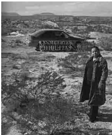
Figura 3 · Mireia Sallarès, Las Muertes Chiquitas , 2006-09. Serie de intervenciones y retratos con anuncio luminoso de neón . Fotografía, 110x95 cm. Carmen. Jardines Torres Quintero, Casa Xochiquetzal, residencia y casa comunitaria para ex trabajadoras sexuales ancianas, barrio de Tepito, México, DF.

Figura 4 · Mireia Sallarès, Las Muertes Chiquitas , 2006-09. Serie de... Fotografía, 110x95 cm. Doña Jose. Predio donde la organización mazahua que ella lidera ha construido bloques de viviendas, callejón Mesones, Centro Histórico, México, DF.