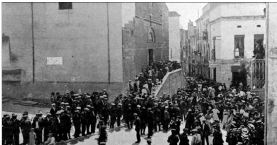
A la sortida de missa, l’11 de juny de 1916, en la jornada d’inici del congrés agrícola de Santa Coloma de Farners.

D’altra banda, per tal d’aconseguir adhesions, la FACB es va guiar sempre per “l’idea de la més amplia autonomia pera’ls organismes que la componen, fins al punt de que si no hi hà unitat de criteri la Federació com a tal no actua”. 32 Aquesta autonomia de les societats federades i la flexibilitat en el l’organització interna de la FACB evitaven les discrepàncies, però constituïen també la seva principal debilitat: tal com afirmava el seu mateix secretari, “la Federació sols és tal Federació quan tots els seus factors estan reunits y convergeixen en un mateix parer. En cas de discrepancia d’un d’ells ab els demés, no hi ha acort, no hi hà Federació”. 33