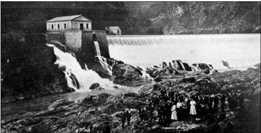
Grup de congressistes al Pasteral.

Els congressos de la FACB també acostumaven a incloure alguna excursió, sovint a alguna finca agrícola destacable de la contrada. El dimarts 13 al matí,