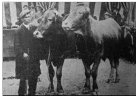
Imatges del concurs de bestiar a la plaça d’Orient de Santa Coloma, amb motiu del congrés agrícola.

Font: J. Sagarra. Rev.IACSI , 20.6.1916. Arxiu Històric de la Ciutat de Barcelona.