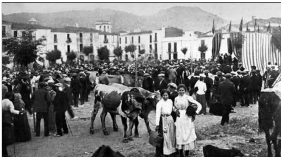
Concurs de bestiar amb motiu del congrés agrícola a la plaça d'Orient de Santa Coloma de Farners.