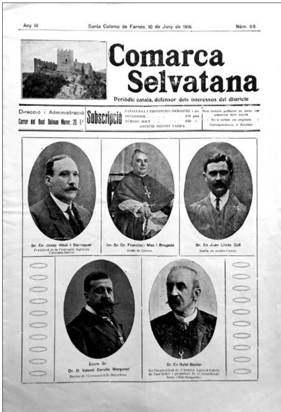
El periòdic quinzenal Comarca Selvatana va publicar un número extraordinari dedicat al Congrés Agrícola, amb retrats a la portada dels seus principals protagonistes.