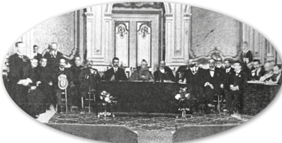
La sessió inaugural del congrés va estar presidida pel bisbe de Girona, Francisco de P. Mas.