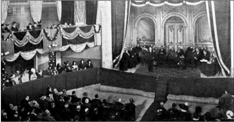
Sessió inaugural del congrés agrícola de Santa Coloma de Farners, al saló-teatre del Cercle Colomenc.