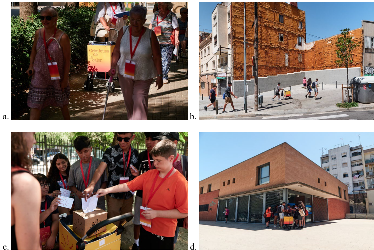
Figure 1. Heat Chronicles' collective thermal walks:

(1) Collection of a continuous geolocated set of temperatures (a and b), and (2) individual anonymous thermal votes on thermal comfort and sensation (c and d).