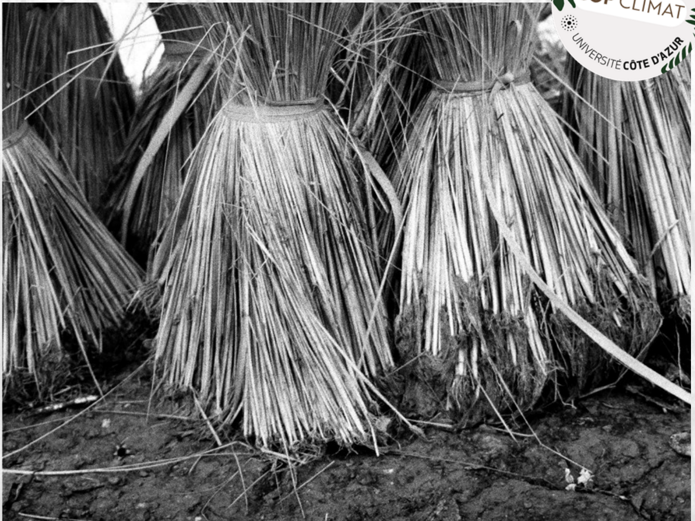
Bottes de riz – Cambodge, 2013 – Christophe Den Auwer