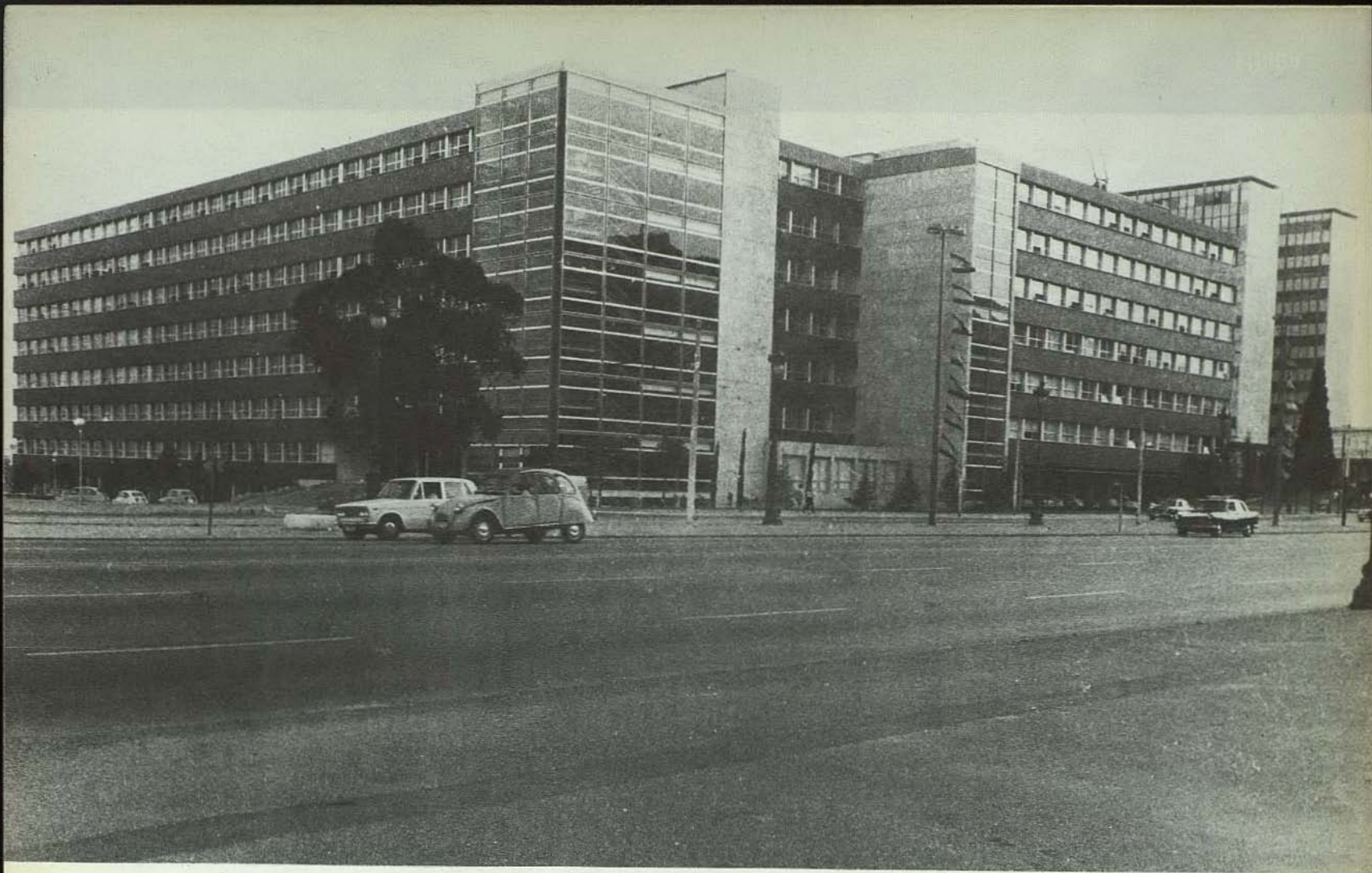
Edificio donde se encuentra la Facultad de Física en la Zona Universitaria de Pedralbes