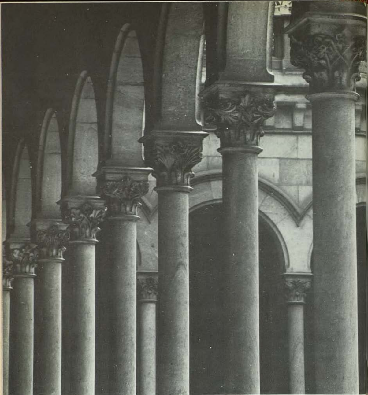
La Facultad de Matemáticas se encuentra instalada en el Edificio Central de la Universidad. Un detalle del patio