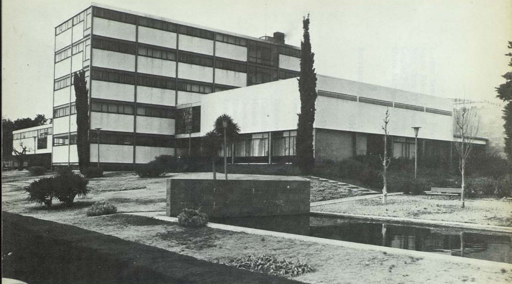
Vista general de la Facultad de Derecho, situada en la Diagonal, próxima al núcleo universitario de Pedralbes