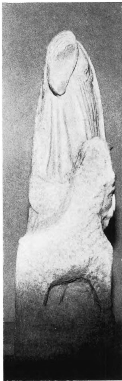
Escultura de Cibeles. Vistas lateral, izquierda y derecha.