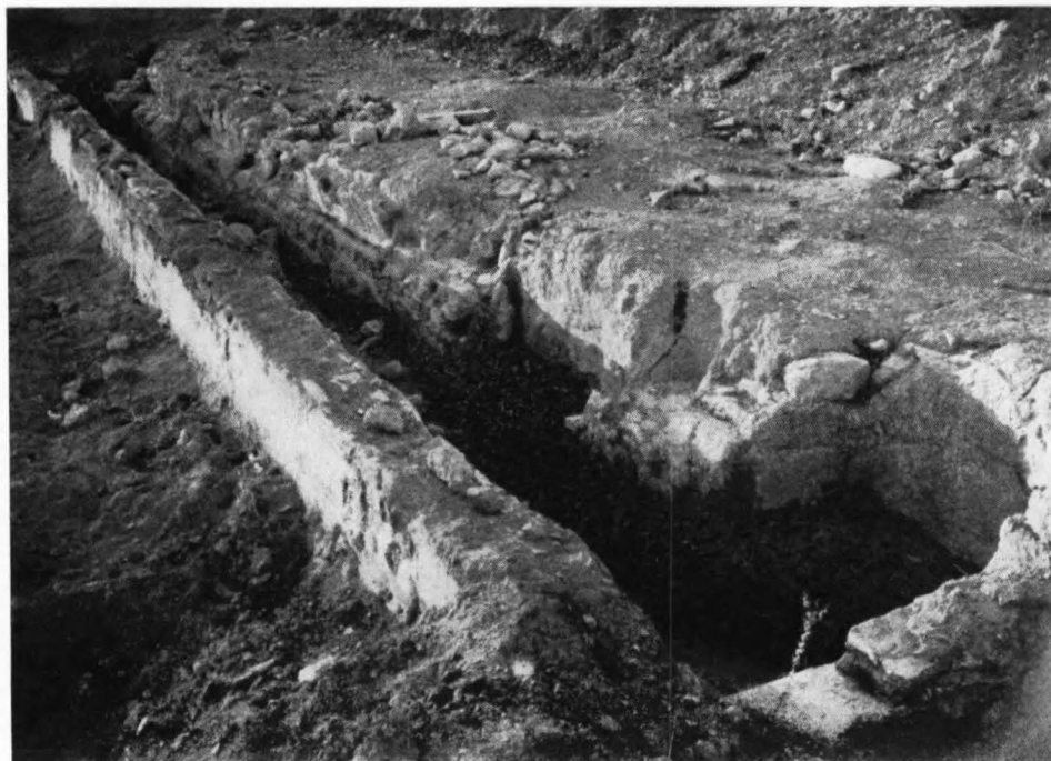
Nymphaeum de la villa romana de «Els Antigons». Sector este, en donde precisamente se halló la escultura de Cibele, poco antes de ser destruido.