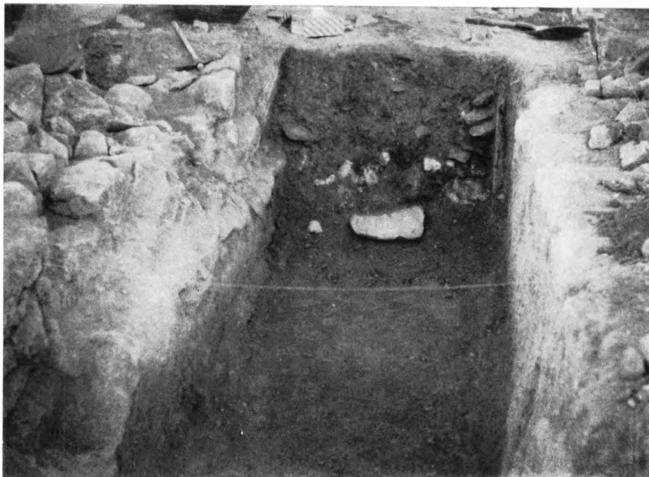
Nymphaeum de la villa romana de «Els Antigons». Detalle del interior.