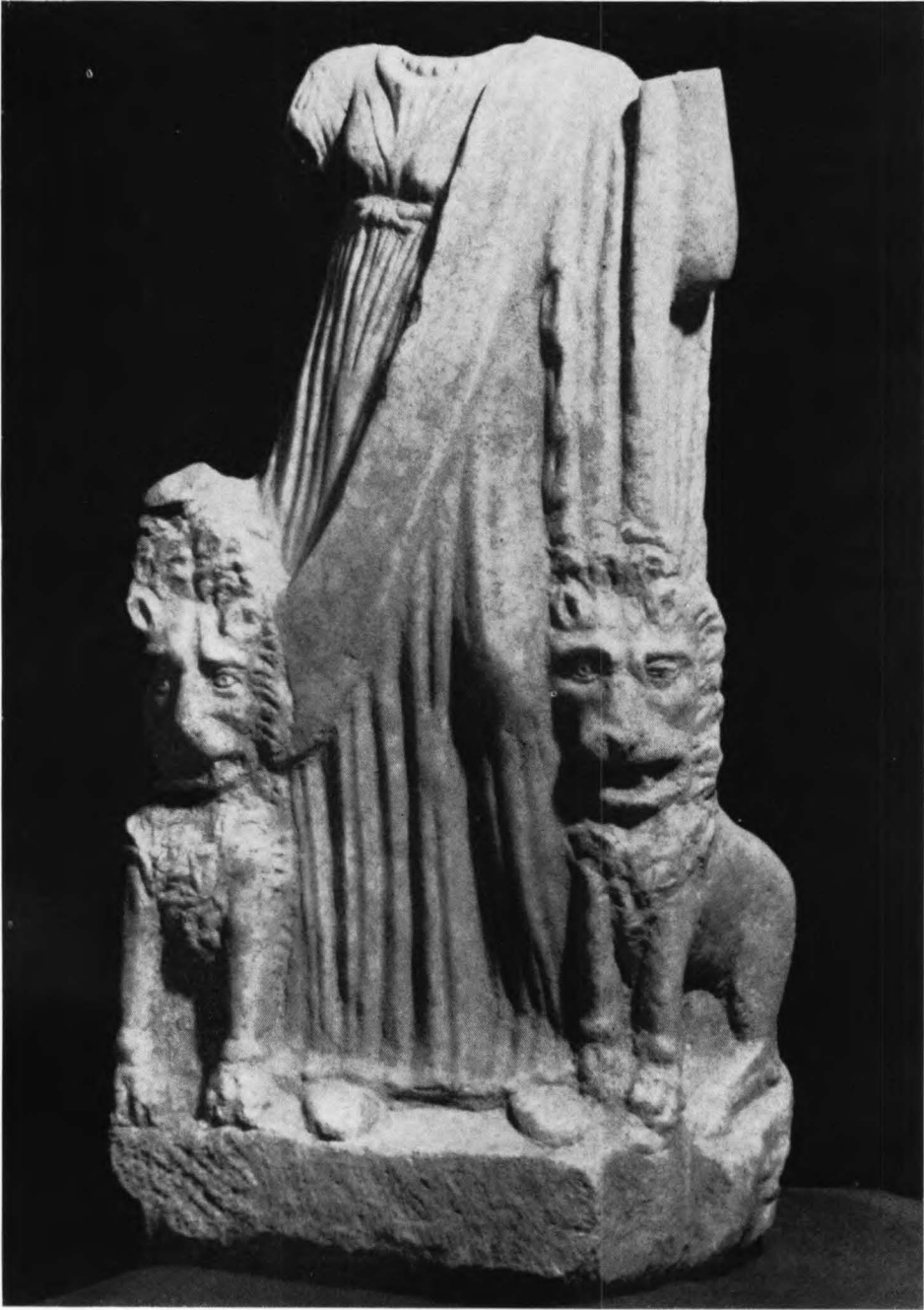
Escultura de Cibele, hallada en la villa romana de «Els Antigons», Reus.