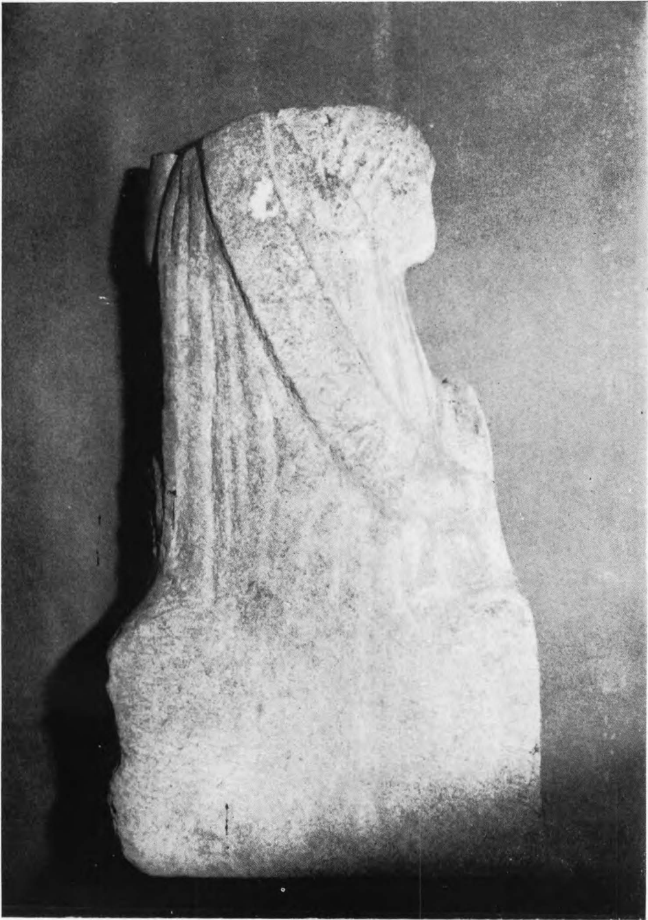
Escultura de Cibele. Vista posterior.