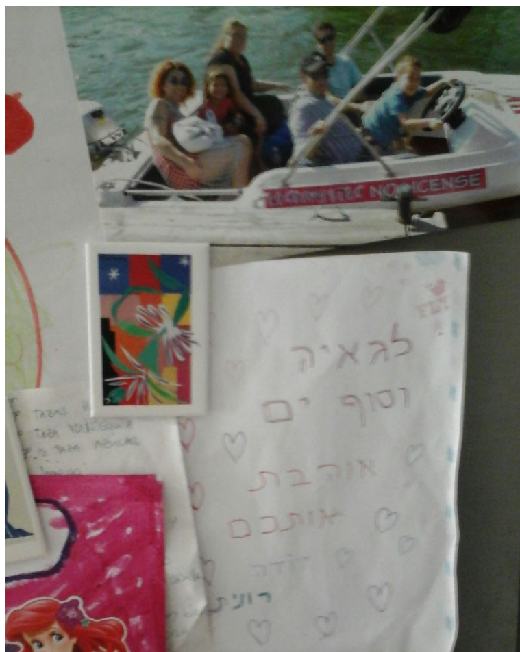
“סטגאנ שפחמ ינא .סיב השפוח”