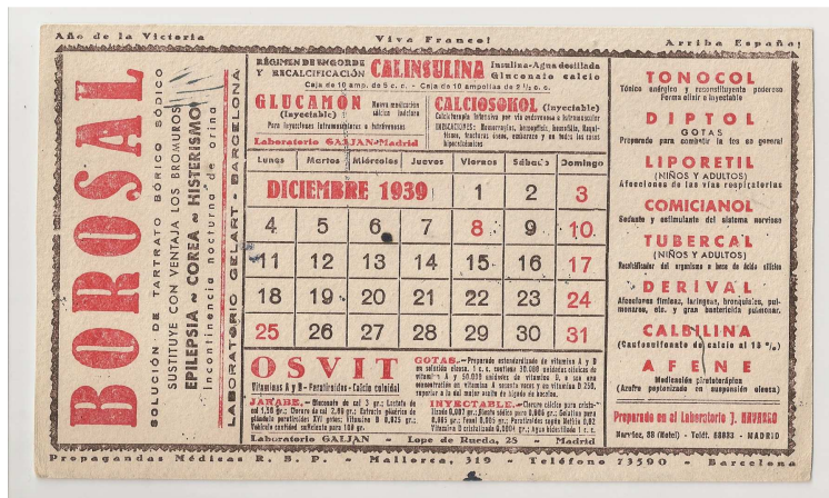
Paper assecant amb propaganda franquista, 1939

estat objecte de nombroses normes relatives a la seva redacció, ha sofert estrictes disposicions en la seva forma i en les seves característiques que, sovint, no s'han complert. El farmacèutic les ha hagut de copiar en els tradicionals receptaris (fonts importants per a la història professional) i, fins i tot, s'han establert severes penes pel seu mal ús o la seva falsificació.