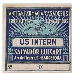
Etiquetes per a fórmules magistrals