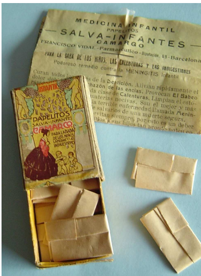
“Paperets” plegats a mà

En fer una breu anàlisi del procés que segueix el medicament en la seva llarga vida, és fàcil adonar-se que el paper és l'element que més presència té en totes les etapes per les que han de passar els remeis, des de la recerca fins a l'administració al malalt.