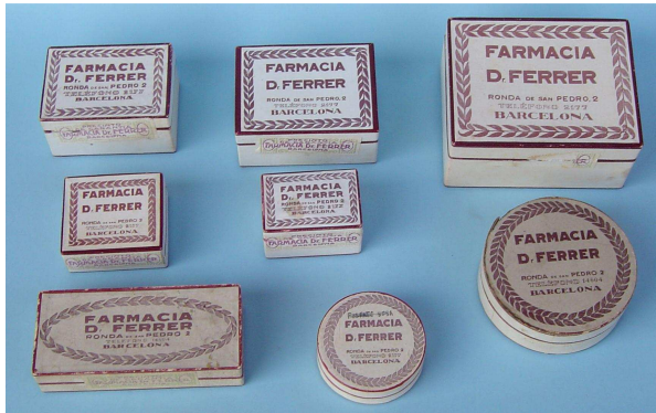
Capses per a fórmules magistrals. Farm. Dr. Ferrer

transport i la conservació , i això per a totes les formes farmacèutiques. En les formes seques, pólvores simples o compostes que no absorbeixen la humitat, són prou conegudes les bossetes de paper; i no cal dir com el cartró simple, sotmès a manipulacions més o menys complexes, ha estat, i encara és, la