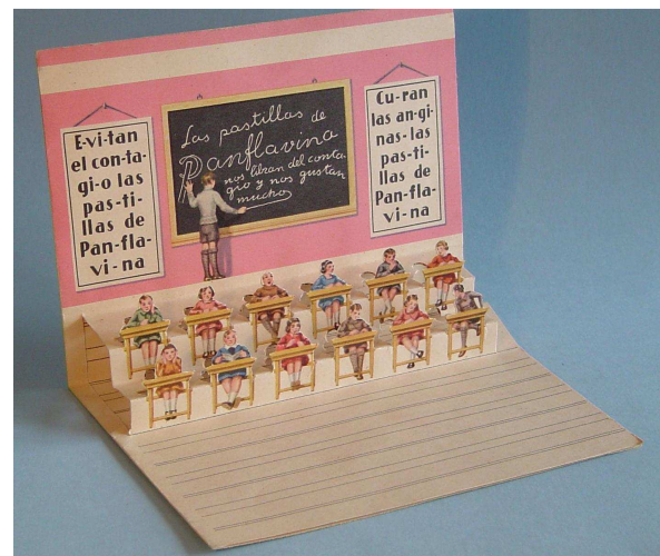
Cartell desplegable infantil