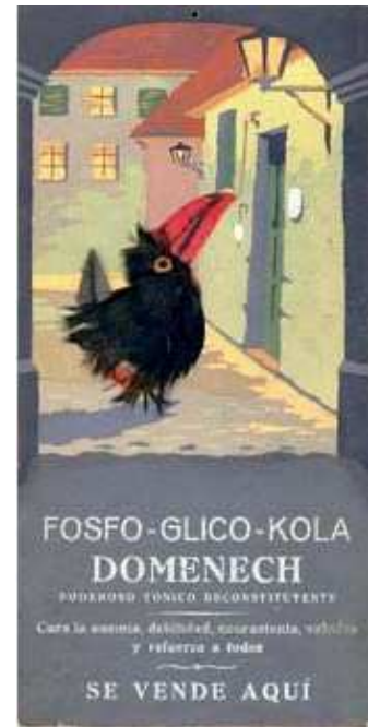
Cartell de sobretaula (les plomes de l'ocell són naturals)

Des del mateix s. XVIII, els anuncis a la premsa escrita; els cartells de paret, de taulell o d'aparador; els vanos o ventalls; els jocs i entreteniments; els calendaris, de paret o de butxaca; les postals; els cromos; els targetons de tota mida; els prospectes; etc. etc. emprant com a suport el paper o el cartró són, també, objectes preuats de col·leccionisme, que constitueixen importants apartats en l'estudi de la petita història de la nostra professió i són, alhora, valuoses mostres del disseny i de la tipografia dels darrers dos-cents anys. Un aspecte molt important de la publicitat farmacèutica, és la literatura que s'hi utilitza; no hi ha dubte que mereixeria un estudi acurat i que constituïria un capítol ben interessant de la nostra història professional.