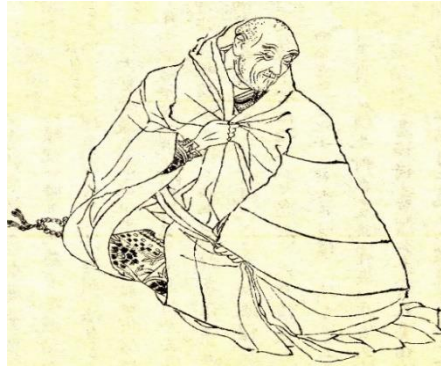
“Taira no Kiyomori en sus últimos años” por Kikuchi Yosai

La figura de Taira no Kiyomori (1118-1181) se encuentra situada dentro del clan familiar Taira, con una ascendencia situada en la propia familia imperial debido a ser los descendientes del nieto del emperador Kanmu (737-806), y que poseerá una rama principal ciertamente importante, los Ise Taira , en la cual encontramos la línea familiar en que se situaran los antecesores del propio Taira no Kiyomori.