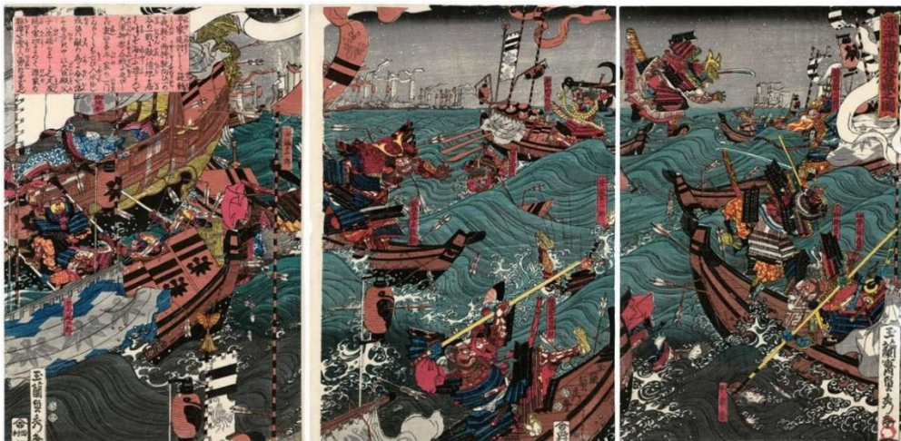
“La gran batalla entre los Minamoto y los Taira en Dan-no-ura ( Genpei Dan-no-ura ôgassen no zu )” por Utagawa Sadahide (1847-1852)

de los miembros restantes del clan, así como la confiscación de las tierras pertenecientes a los mismos ( Heike-bokkon-ryo ) y pasando a propiedad de los Minamoto. Este tipo de dinámica de “castigo” sobre los derrotados será la tónica general que se emprenderá con todos aquellos clanes que dieron su apoyo o se aliaron con el clan Taira. También podemos observar que este proceso de confiscación de las tierras y propiedades de los vencidos, pasarían a estar en manos de clanes guerreros e individuos que favorecieron la victoria del clan Minamoto, así como también la distribución de bienes y funciones, mediante los méritos militares a lo largo del conflicto. De esta manera, podemos observar una reorganización de las propiedades afectadas, pasando a conformar el patrimonio de nuevos clanes o de figuras relevantes durante el conflicto. Provocando de esta manera una sustitución de las antiguas autoridades, y estructuras de poder, de estos territorios por “nuevas personalidades” surgidas del propio conflicto o la posible vinculación a clanes procedentes de territorios situados en la zona de Kanto.