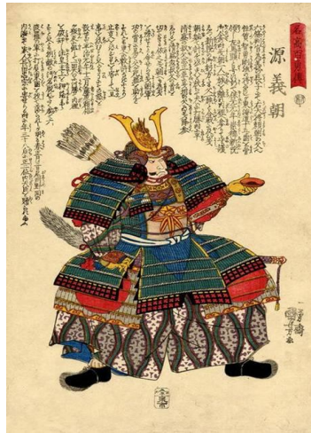
“Minamoto no Yoshitomo” por Utagawa Kuniyoshi (1843-1844)

Ante el creciente poder, cada vez mayor, de los clanes bushi provinciales, podemos observar el inicio de las tensiones de los mismos encabezados por el clan Minamoto 22 en 1159, en la llamada Rebelión Heiji ( Heiji no Ran ). En ésta podemos observar ciertos elementos de una aparente guerra civil interna 23 , observando el enfrentamiento de los dos clanes principales del momento, el clan Taira y el clan Minamoto, ambos con una voluntad de conseguir el favor del emperador retirado Go-Shirakawa por tal de poder imponer su propia voluntad sobre las propias políticas de la corte imperial.