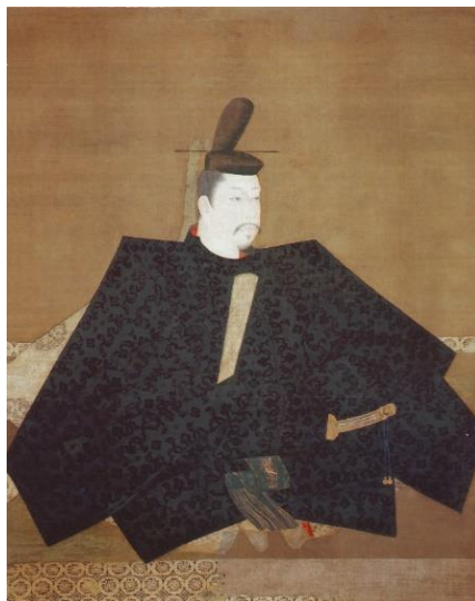
“Minamoto no Yoritomo” por Fujiwara Takanobu (1179)

El origen de la propia figura de Minamoto no Yoritomo (1147-1199), tal y como ya he ido apuntando en el apartado anterior, se encuentra situada en el interior de la rama familiar dirigente de uno de los grandes clanes del Japón del momento, así como uno de los principales protagonistas y dirigentes de la Rebelión Hogen (1156) y la Rebelión Heiji (1159), el clan Minamoto. Debido a que el propio clan Minamoto se encuentra situado entre las filas de los clanes bushi provinciales ( Genji ), lo cual parece mostrar una cierta separación con respecto a la autoridad que llegan a ostentar las propias familias y clanes cortesanos ( Heiji ). Así mismo, a raíz de la separación de los intereses familiares del propio clan a causa de la Rebelión Hogen ( Hogen no ran ), en la cual el propio Minamoto no Yoshitomo se enfrentó a su propio padre, Tameyoshi, en favor de la autoridad imperial, así como también lo hizo el clan Taira, favoreció el asentamiento de una situación del propio clan como uno de los principales grupos de poder del momento.