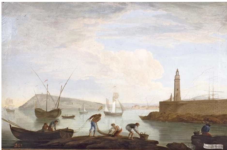
Mariano Sánchez: Llanterna de Barcelona . 1788. Oli sobre tela, 69 x 104 cm (Madrid, Museo Nacional del Prado).

La segona vista del port de Barcelona realitzada per Mariano Sánchez il·lustra a la perfecció l'objectiu primer de la sèrie pictòrica en què s'inscriu, ja que l'element més significatiu de la mateixa és la llanterna. D'aquí el seu títol: Llanterna de Barcelona . 36 De nou amb una línia de l'horitzó molt baixa, que confereix protagonisme a la captació atmosfèrica, el pintor valencià, situat a la costa, obre una àmplia panoràmica del litoral barceloní amb la muntanya de Montjuïc al terç esquerre i la llanterna al dret. Al centre, uns pescadors recullen les xarxes i nanses en primer pla, mentre una embarcació a vela travessa el segon. Es tracta d'una composició molt equilibrada i també meditada, on l'artista aconsegueix una gran amplitud de camp amb l'ajuda de la càmera òptica, malgrat el racó escollit per a l'enquadrament.