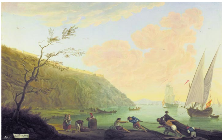
Mariano Sánchez: Montjuïc, por el oeste . 1788. Oli sobre tela (Madrid, Patrimonio Nacional).

Sens dubte, la més original de les tres pintures que Mariano Sánchez dedicà al litoral barceloní és la intitolada Montjuïc, por el oeste . En el registre de despeses presentat al rei, transcrit per José de la Mano, 44 consta el lloguer d'una calesa per a traslladar-se fins en aquest punt situat a l'altra banda de la muntanya. La precisió topogràfica és altre cop inqüestionable. Amb l'ajut de la càmera òptica i dels apunts presos en directe, el pintor reproduïx de manera molt descriptiva la silueta del turó i el perfil de la fortalesa de Montjuïc, reformada i ampliada per l'enginyer militar Juan Martín Zerméño en temps del marquès de la Mina (c. 1751-1753). S'hi aprecia clarament el baluard de Don Carles a la costa i la "lengua de sierpe" cap a l'interior, units ambdós elements per un senzill llenç de muralla, que els penya-segats contigus reforcen. 45 Al peu del turó, l'aigua sembla endinsar-se en el terreny, veient-se algunes barques atracades en una vora, mentre a l'altra –en primer pla de la composició– uns homes s'esforcen a vèncer la resistència de la sorra per amarrar; accions totes elles, a banda de les embarcacions fondejades que es retallen a la llunyania, que assenyalen el reduït calat de l'indret.