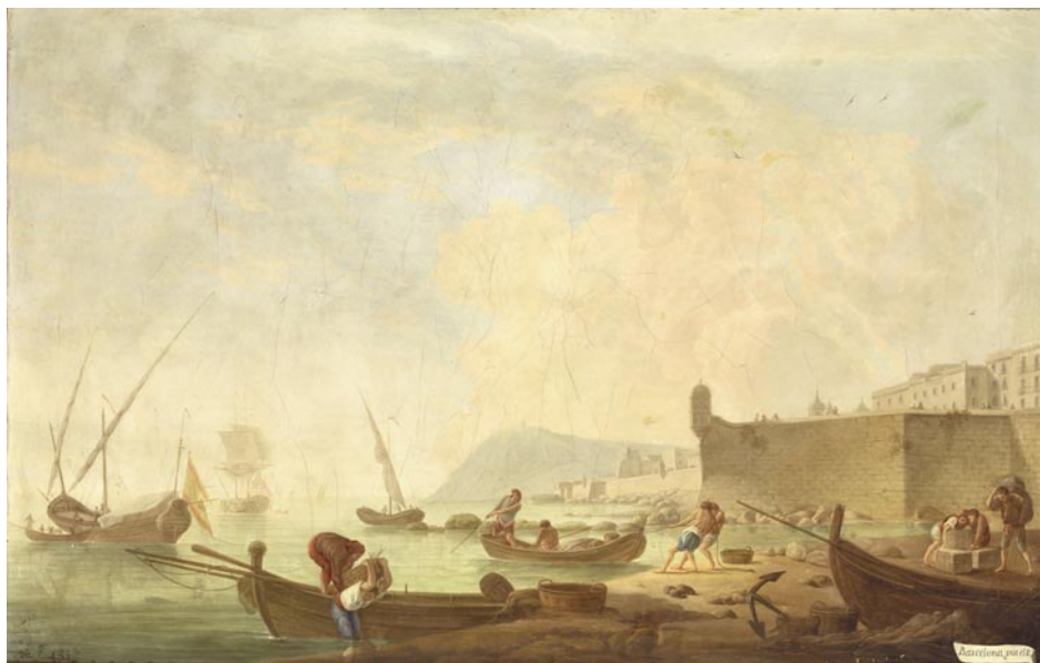
Mariano Sánchez: Barcelona por el Este . 1788. Oli sobre tela (Madrid, Patrimonio Nacional).

Aquesta petita platja de secció triangular s'havia anat formant a l'extrem més intern del port, quasi al davant del Portal de Mar, construït entre els anys 1554 i 1560 i conegut avui gràcies al fidel dibuix d'Anton van den Wyngaerde. 33 Com bé detalla la pintura de Mariano Sánchez, aquesta platja era un embarcador per a petites naus de cabotatge. S'hi aprecia, per exemple, l'arribada d'una càrrega de carreus de pedra, procedents potser de la veïna pedrera de Montjuïc. Cal tenir en compte que tot just creuat el desaparegut Portal de Mar, en forma d'arc de triomf i rematat per un frontó triangular, es trobava tota l'activitat comercial i mercantil de la ciutat l'entorn de les places del Vi i de la Llotja.