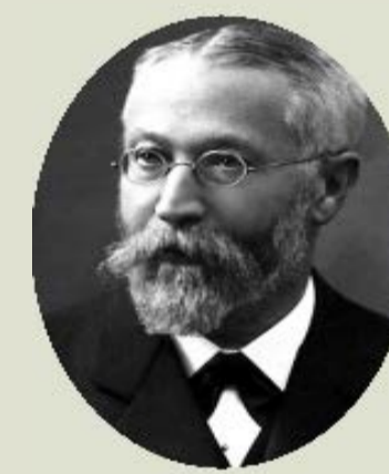
BRAUN, K.F. MARCONI, G. Desenvolupament de la telegrafia sense fils, 1909