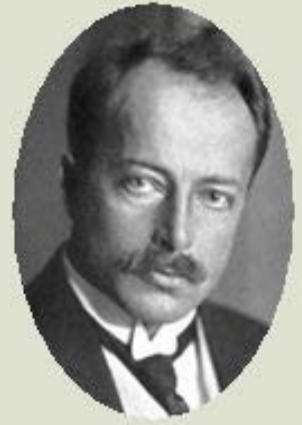
VON LAUE, M., 1914 Difracció de raigs X