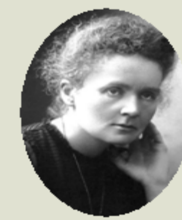
CURIE, M., 1911 Descobriments del radi i del poloni