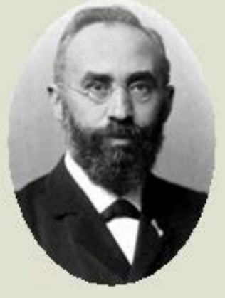
LORENTZ, H.A. ZEEMAN, P. Explicació de l'efecte Zeeman, 1902