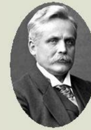
WIEN, W., 1911 Radiació del cos negre