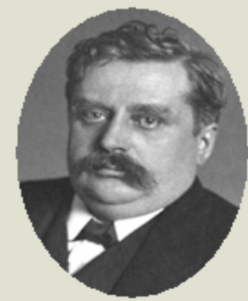
WERNER, A., 1913 Teoria de la coordinació