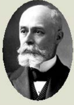
BECQUEREL, A.H. CURIE, M. CURIE, P. Descobriments de la radioactivitat espontània, 1903

Com les teories clàssiques eren insuficients per a explicar els nous fenòmens, els primers premis Nobel van ser atorgats no tan sols als seus descobridors i als inventors d'algunes aplicacions, sinó també els qui van proposar-ne les explicacions teòriques.