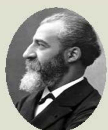
MOISSAN, Henri, 1906 Forn elèctric i aïllament del fluor