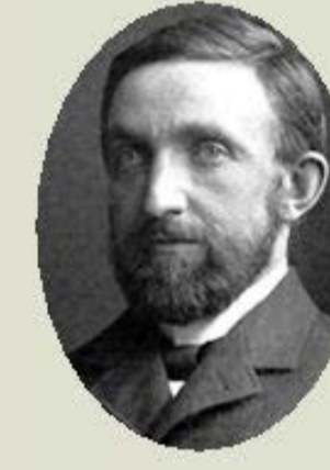
LENARD, P.E., 1905 Propietats dels raigs catòdics