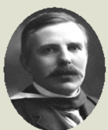
RUTHERFORD, E., 1908 Química de les substàncies radioactives