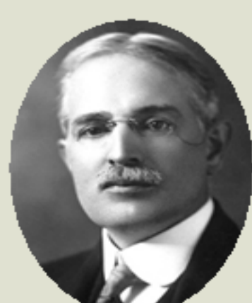
RICHARDS, T.W., 1914 Determinació acurada de pesos atòmics