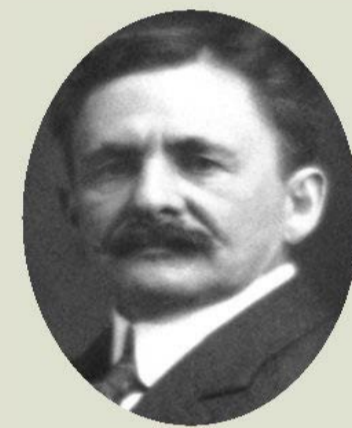
LIPPMANN, G., 1908 Desenvolupament de la fotografia en color

Des d'un principi els Nobel van premiar certes aplicacions de la teoria per contribuir al "benefici de la humanitat", segons el desig d'Alfred Nobel: la telegrafia sense fils , el desenvolupament de la fotografia en color , el disseny d'automatismes per a la il·luminació , i certs Instruments òptics de precisió .