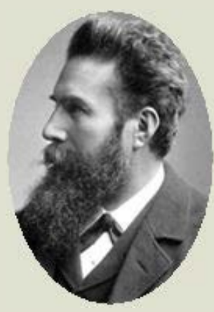
RÖNTGEN, W.C., 1901 Descobriments dels raigs X