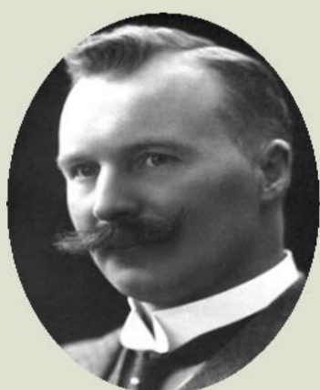
DALEN, N. G., 1912 Construcció de reguladors automàtics d'il·luminació