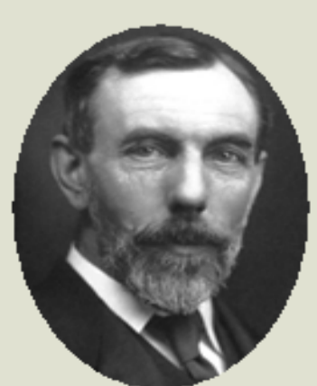
RAMSAY, W., 1904 Descobriments dels gasos nobles

El descobriment dels gasos nobles (1894-1898), del flúor (1886), dels elements radioactius poloni (1898) i radi (1910), l'estudi de la seva química (1898-1907), i la determinació acurada dels pesos atòmics de la majoria d' elements permeteren completar la Taula Periòdica dels elements i establir-ne llurs varietats isotòpiques. També es desenvolupà la teoria moderna de la coordinació (1893) dels compostos inorgànics i es dissenyà un forn elèctric d'alta temperatura que permeté reduir minerals de metalls pesants.