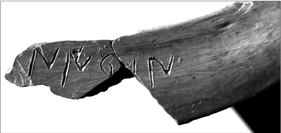
Fig. 6. Segona part de la inscripció, [- -]nirban (esquerra del fragment conservat)

Pel que fa a la segona part de la inscripció, a l'extrem esquerre del fragment han perviscut cinc signes d'una seqüència incompleta per l'inici, però completa pel final; es podria correspondre amb l'acabament del text, o, alternativament, amb una seqüència independent. Els signes 2 i 3 d'aquesta part són incomplets, però la seva interpretació com a r6 i ba1 sembla segura.