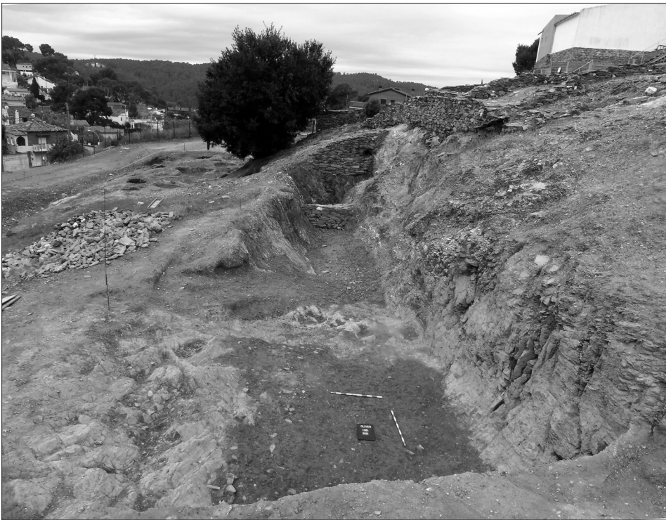
Fig. 1b (inferior). Fossar on s'han localitzat les peces