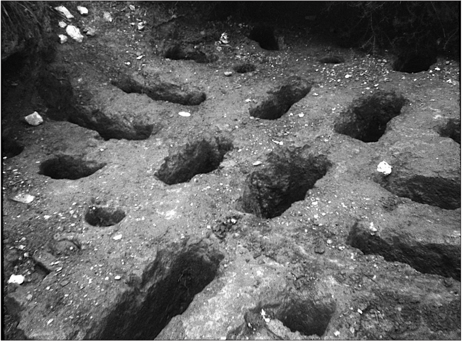
Fig. 2. Forns del vessant sud, actualment desapareguts

tingué continuïtat al llarg dels segles següents, en què la producció continua activa, com posen de manifest els forns de la banda sud del poblat, que podem datar entre el final del segle II i la primera meitat de l'I aC (fig. 2). Per a poder afirmar amb tota certesa que totes les marques localitzades al jaciment corresponen a artesans locals caldrà, tanmateix, analitzar les pastes ceràmiques per tal d'establir si es tracta de produccions in situ .