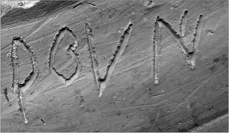
Fig. 5b. Detall de la part final de la primera part de la inscripció, -ar-mi, amb el signe beoide