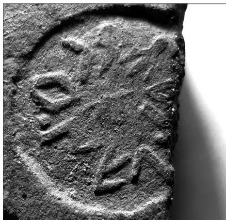
Figs. 3a i 3b. Dibuix i fotografia de la inscripció estampillada sobre doli