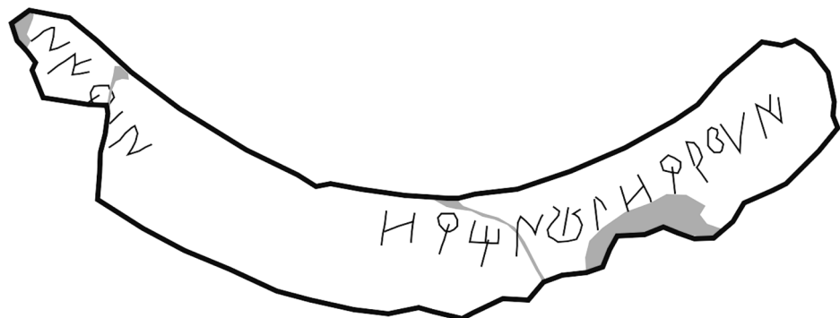
Figs. 4a i 4b. Imatge general i dibuix de la nova inscripció sobre càlat