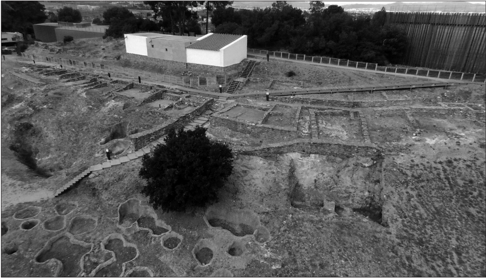
Fig. 1a (superior). Perspectiva del jaciment