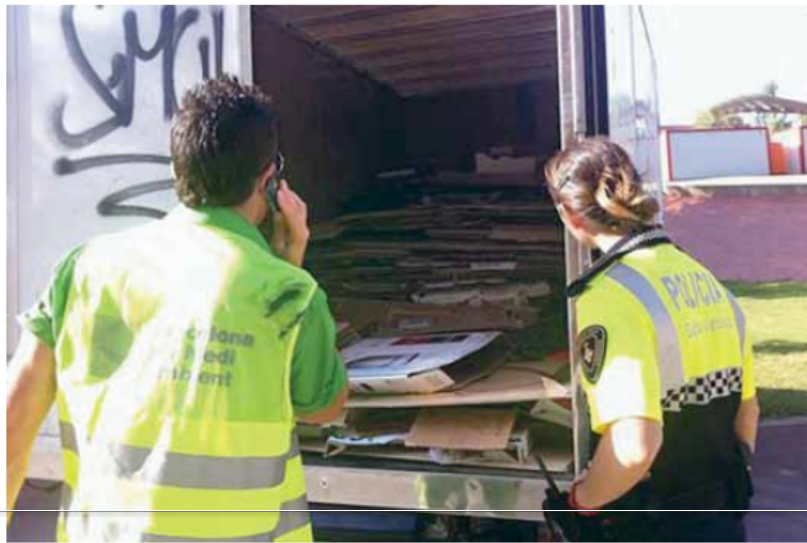
← Una agent de la GUB inspecciona el camió que utilitzava com a dipòsit un grup de lladres de cartró

La Guàrdia Urbana multiplica per sis les denúncies relacionades amb la recollida il·lícita de cartró i material per al reciclatge a Barcelona