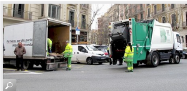
La Guàrdia Urbana intercepta un camió ple de cartró a l'Eixample.