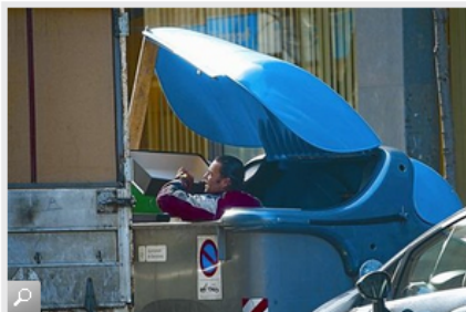
Un hombre saca cajas de cartón de un contenedor de reciclaje del Ayuntamiento de Barcelona, en febrero del 2011.

En tiempos de la gran cuchipanda económica, los saqueadores de contenedores de papel y cartón eran, desde el punto de vista de muchos ciudadanos, los gorriones que se comían las migas del festín. Algo llamativo, no bucólico por supuesto, pero intrascendente. El final de la gran parranda ha cambiado el color del cristal con el que se observa la realidad. Los responsables de Medio Ambiente del Área Metropolitana de Barcelona (AMB), con Assumpta Escarp al frente, presentaron ayer un primer avance de las cifras de consumo agua, generación de residuos y reciclaje de los 36 municipios de esa gran conurbación urbana. Entre muchas cifras, despunta, entre otras, precisamente esa, que un 19% del papel y cartón que los ciudadanos pacientemente depositan en los contenedores jamás llega a ser recogido por los camiones de las empresas concesionarias del servicio. Con cada vez menos nocturnidad, una red paralela de furgonetas vacía esos contenedores. Al año, ese pillaje reporta un botín anual a sus autores de 1,5 millones de euros.