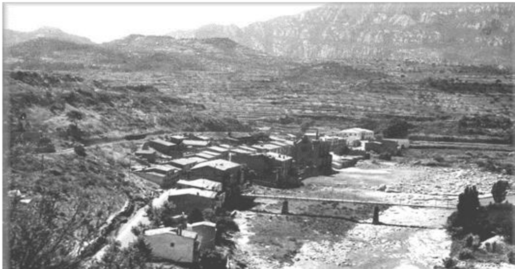
Barri de la Bauma i pont de la fàbrica a 1908.