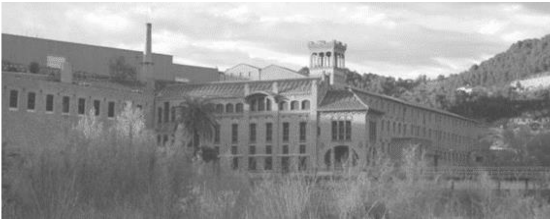
Fàbrica de la Bauma reformada amb la torre de l'amo en primer pla.