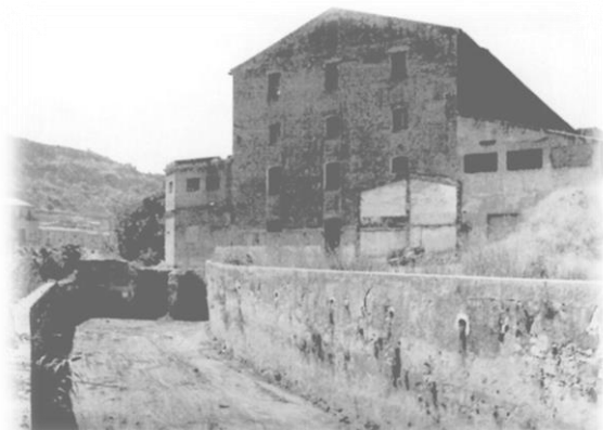
Canal amb les dues entrades d'aigua

Les fàbriques es van començar a construir al juny de 1859 pel "mestre de cases" Joan Ribatallada, amb el compromís d'acabar l'obra en sis i nou mesos (eren dos edificis).