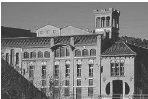
Torre de l'amo

La Torre de la Bauma, que també, com l'església, va ser construïda entre 1905 i 1908, va ser restaurada als anys 80 pels últims amos de la fàbrica, Nerpel S.A., de forma que