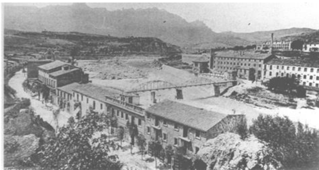
Vista general de la Bauma a 1908

La Bauma és una antiga colònia tèxtil fundada a mitjans del segle XIX, en concret a 1859, que es va construir en un extrem del congost de la Bauma, on el riu forma un meandre molt pronunciat, a un km aigües avall del Borràs. El nom de la Colònia de la Bauma es deu a que està construïda en la zona anomenada la Bauma 31 del poble de Castellbell. La Bauma era (i és) el segon nucli més poblat del municipi, després del Borràs i forma un nucli diferenciat i separat de la resta del municipi, amb una personalitat pròpia.