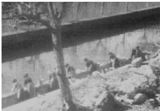
Safareig de la Bauma