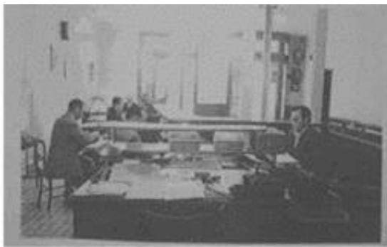
Personal treballant al despatx 1

El despatx constituïa un mon apart. A la Bauma, durant els primers anys, el responsable màxim de la fàbrica, y per tant del despatx era el majordom, però després el director va ser la màxima autoritat i era el fil directe amb Barcelona. En el despatx la segona figura en importància era “el primer escrivent” o “administrador”, que era realment el “cap del despatx” i s’encarregava de tota la paperassa, a més era el que