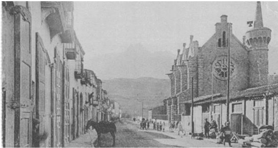
Església de la Sagrada Família a 1920

L'església, situada a la carretera de la Bauma, molt a prop de l'entrada a la fàbrica, va ser construïda per l'arquitecte Alexandre Soler i March, arquitecte català deixeble de Domènech i Montaner i que va dirigir l'Escola d'Arquitectura des de 1931 a 1936. Les obres van començar al febrer de 1905 i es va construir amb aportacions de la família Vial, i també, en menor quantia, del bisbat de Vic. Es va inaugurar el primer diumenge de maig de 1908, amb una gran festa tal com descriuen les cròniques de l'època: