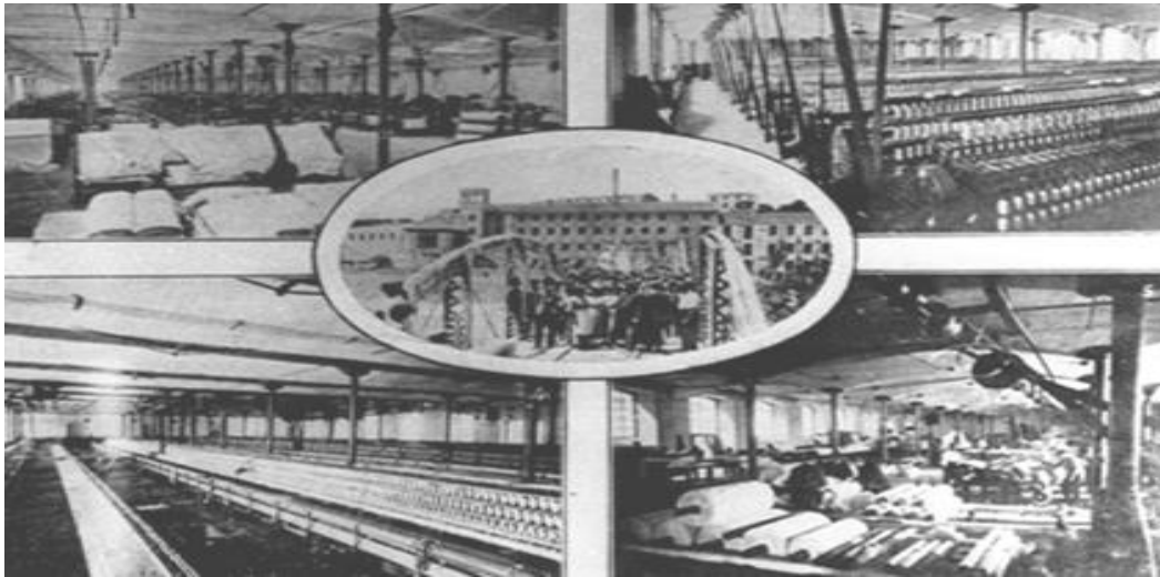
Naus de la fàbrica i Sortida del treball

En una etapa posterior, a més de filar i teixir, les peces teixides es blanquejaven o es tenyien i finalment s'acabaven, de forma que a la fàbrica de la Bauma, fins i tot ser una empresa mitjana, es feia tot el procés tèxtil.