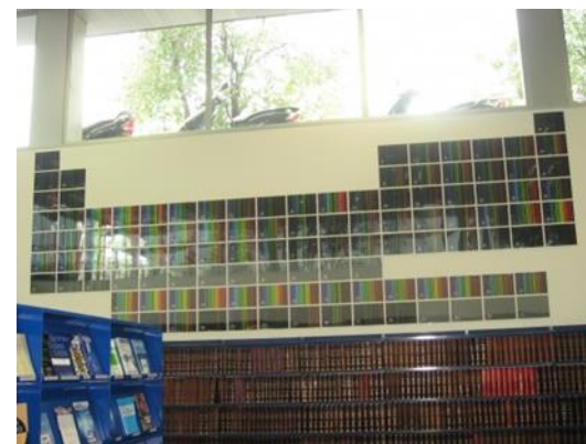
El Chemical Abstracts a l'antic Seminari de Química i a l'actual Biblioteca