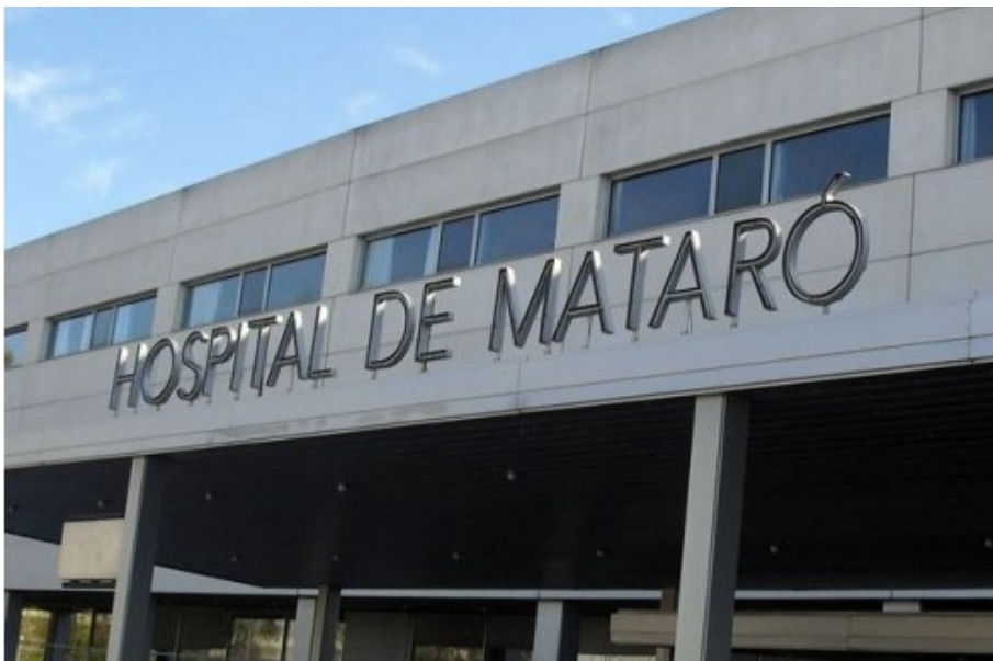
Part exterior de l'Hospital de Mataró