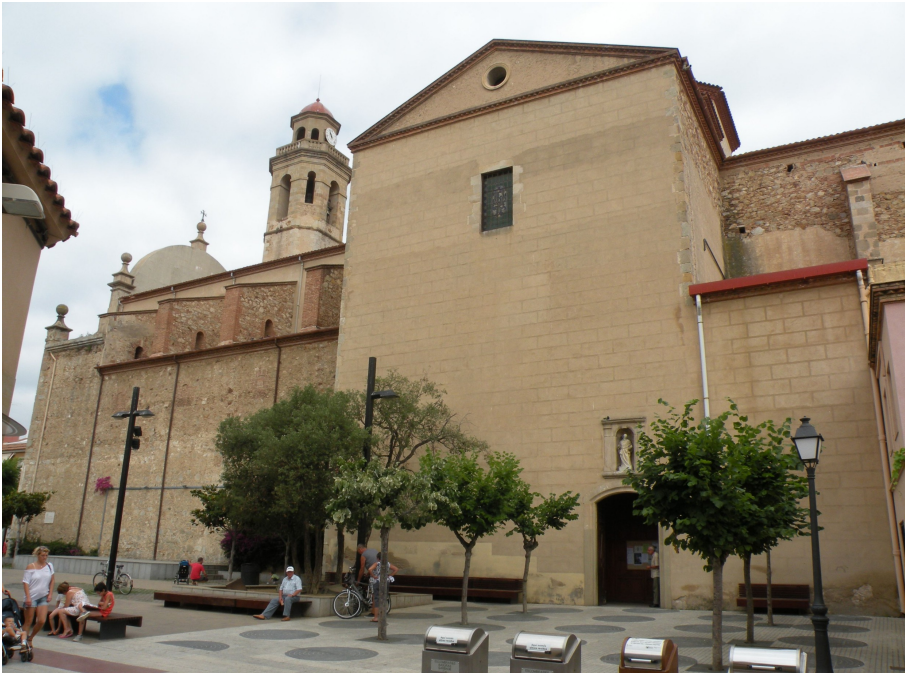
Façana de l'església de Calella

El nostre rodatge es va centrar en tres localitzacions: el poble de Calella, l'hospital de Mataró i un carrer de la mateixa ciutat. Per una banda, al poble de Calella vam rodar al carrer Francesc Bartrina per realitzar l'escena de l'accident, a la plaça de l'Església i també a l'interior d'aquesta i, per últim, a casa d'una de les companyes d'equip. Per altra banda, a la ciutat de Mataró vam rodar, principalment, a dins de l'hospital, en una sala en concret que teníem reservada, i, després, en un carrer a prop del mateix hospital per gravar una escena a l'exterior.