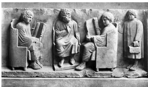
Il·lustració 2: Relleu en marbre del segle III d.C. que representa una escena escolar.

Fer esment, i tot tancant el tema, que l'educació i la formació romana seguia fins la vida adulta en diferents escoles i diferents continguts formatius, però com que aquests s'allunyen de la temàtica que s'està treballant amb aquest projecte