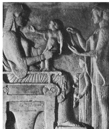
Il·lustració 1: Nodridora que presenta el fill a la mare moribunda per al darrer adéu. Estela funerària de Villa Albani (Roma) del segle VI a.C.

El primer que hem de destacar en aquesta educació és que les ensenyances es duien a terme de forma bilingüe distingint entre el llatí i el grec a més de l'accentuació de l'ús del llibre i de diferents manuscrits en contra del pensament i judici propi de l'alumnat. Llavors, l'educació romànica, i tal i