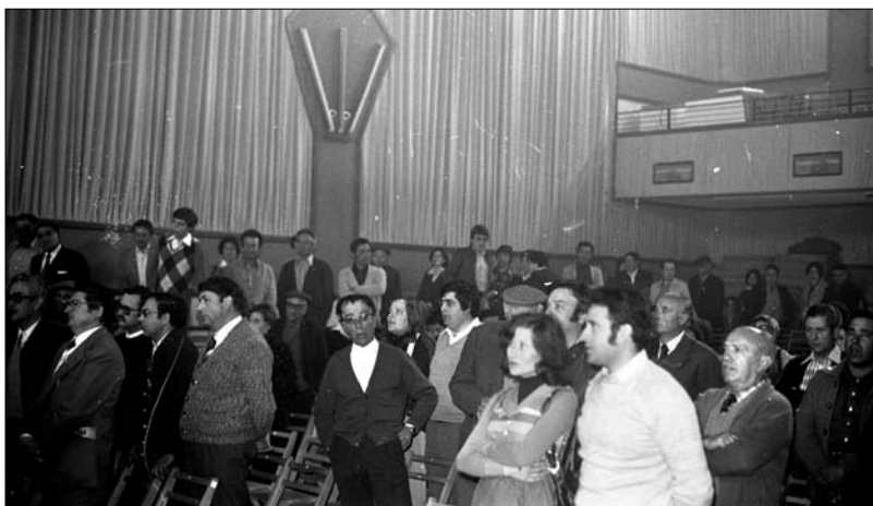
□ Assistents al mítting de CDC. (Maig de 1977)

Com ja hem comentat, CIU (PDPC el 1977) aconsegueix la victòria de manera continuada a partir de 1986, amb l'excepció del 2008, tot i que amb percentatges sensiblement inferiors als que s'observen a les eleccions al Parlament de Catalunya. En aquests casos, els percentatges rondan el 40%, excepte en les davallades del període 2004-2008, amb les victòries socialistes a l'Estat. Aquests resultats són similars en alguns casos (1982-1996) i lleugerament diferents en d'altres (a partir del 2000) als que s'observen en el conjunt de la comarca. Per contra, són bastant inferiors als que aquesta formació obté en el conjunt de Catalunya. Aquest resultat és significatiu perquè no mostra gaire variacions respecte al que observàvem a les eleccions al Parlament català i que, de nou, també veurem que es repeteix quan analitzem els resultats d'ERC. D'aquí es podria concloure que a Vila-rodona, tot i que hi ha una major mobilització de l'electorat en aquesta contesa electoral que no pas en les eleccions al Parlament català, el traspàs de vots des de formacions més nacionalistes com ara CIU i ERC cap al PSC és força menor al que s'observa de manera agregada per al conjunt de Catalunya.