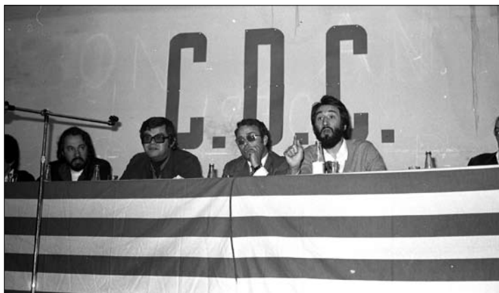
□ Mítting de CDC a Vila-rodona. (Maig de 1977)