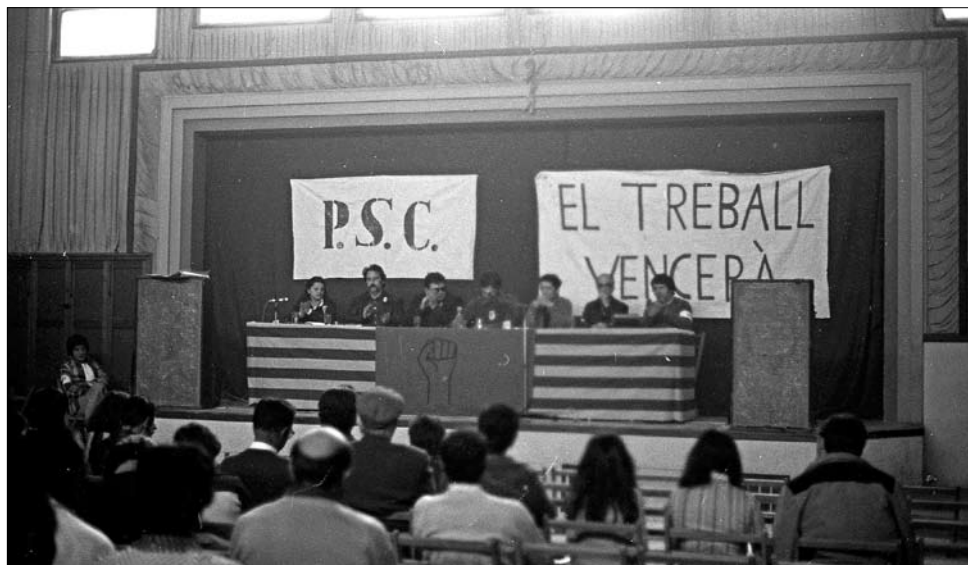
□ Mítting del PSC a Vila-rodona. (Abril de 1977)

Tal com hem comentat, amb l'excepció de la victòria de la UCD el 1979, la victòria ha estat de CiU. Pel que fa a la participació, també trobem un nivell de participació superior a les eleccions al Parlament de Catalunya i més pròxims als que trobàvem a les eleccions municipals, al voltant del 75%, tot i que hi ha variacions importants en els anys 1982, 1993 i 2004. Els vots blancs i nuls són poc significatius durant tot el període, amb l'excepció del 2004.