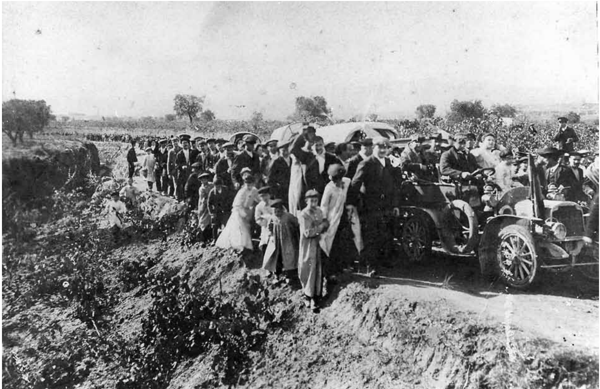
La comitiva encapçalada per l'automòbil amb els godonistes alliberats durant el trajecte de l'estació de Piera al nucli dels Hostalets.

que va publicar una carta datada als Hostalets el dia 30 de juliol i que deia: