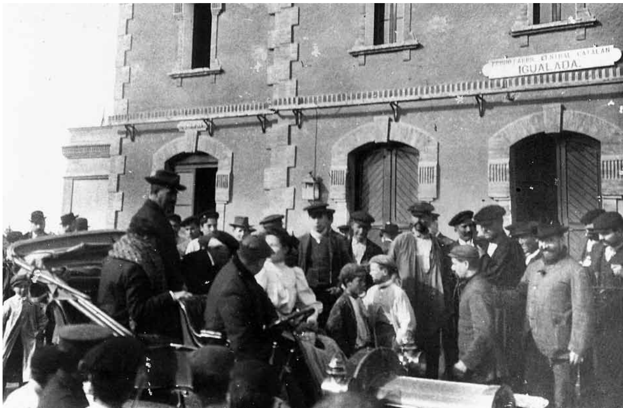
L'arribada a l'estació d'Igualada dels godonistes hostaletencs condemnats, després de sortir de la presó el 4 de novembre de 1906.

malhechores llevaban intenciones siniestras. El señor Roviralta salió, sin embargo con graves lesiones que le obligaron a guardar cama por algún tiempo».