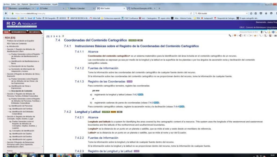
Figura 3. RDA Toolkit, la plataforma de acceso a la nueva normativa.

Una vez las pautas hayan sido publicadas en la web, se procederá a diversos tipos de formación. Por un lado, la formación de formadores que permitirá a los miembros del CCUC realizar las formaciones internas en cascada en sus respectivas instituciones. Pero no hay que olvidar que en el catálogo también crean registros instituciones colaboradoras (como museos, fundaciones o institutos de investigación), así como proveedores documentales, que realizan pre-catalogaciones como valor añadido a sus servicios, y que también deben ser formados.